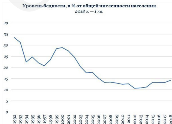
Таблица 1. Динамика уровня бедности в России (1992–2018 г.г.)