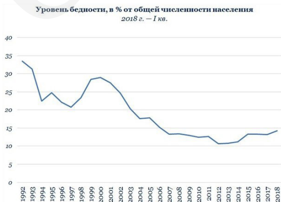
Таблица 1. Динамика уровня бедности в России (1992–2018 г.г.)