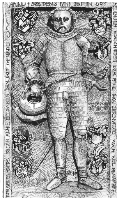
2. Nagrobek przed osobą Franza von Dyherrna, rys. autorstwa M. Kruszewskiej