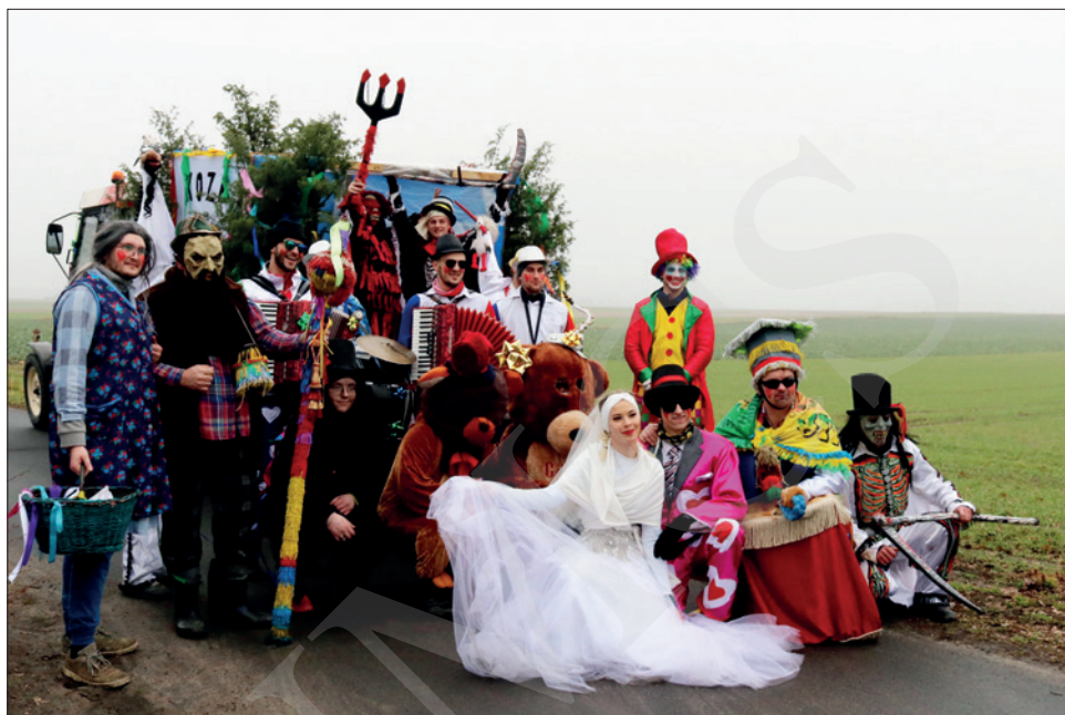
Група пераапанутых Koza Florianowo 10 лютага 2024 г.

Хаця „хаджэнне з казой” на Куяві адбываецца на Запусты, а шчадраванне „Конікі” ў Давыд-Гарадку – напярэдадні Старога Новага года, гэтыя звычэй тыпалагічна блізкія, бо іх аснову складае абыход двароў пераапанутымі персанажамі як частка абраду пераходу у тэрміналогіі Арнольда Ван Генэпа (1909), і таму параўнанне іх асвятлення ў медыя абгрунтаванае. У абодвух выпадках абыходы праходзяць спантанна, без умяшальніцтва работнікаў культуры, хаця праводзяцца і арганізаваныя „зверху” мерапрыемствы: у выпадку Куяві гэта гмінныя прагляды запустных гуртоў у Тапульцы, Ізбіцы Куяўскай і Любранныцы, а таксама шэсце ва Ёлацлаўку, а ў Давыд-Гарадку – канцэрт з дыскатэкай на Цэнтральнай плошчы і конкурс на лепшага „коніка”. У абедзвюх даследаваных мясцовасцях да традыцыйных персанажаў у гуртах пераапанутых дадаюцца новыя. Абудва элементы ўнесены ў нацыянальныя спісы НКС у 2020 г.