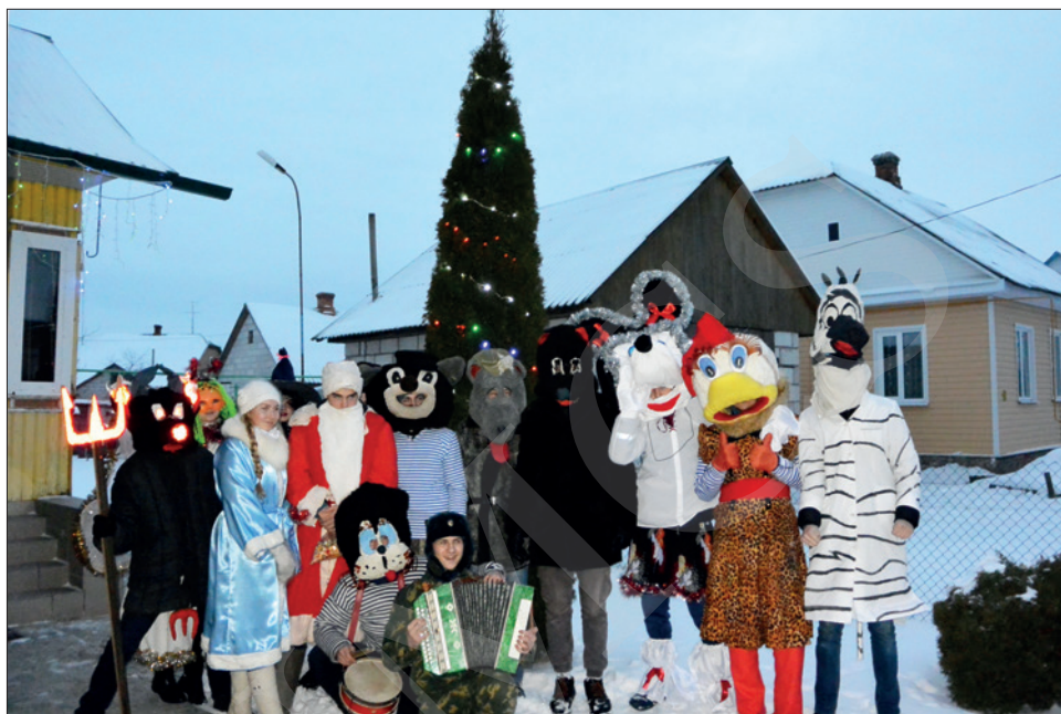
Адна з груп „Конікаў” у Давыд-Гарадку 13 студзеня 2017 г.

s. 321–322). Аўтарка гэтага тэксту апісала „Конікаў” пасля выезду ў Давыд-Гарадок у 2017 г. (Leshkevich, 2022, s. 33–34) і прасачыла трансфармацыю абраду, параўноўваючы яго з „хаджэннем з казой” на Куявіі (Leshkevich 2023b).