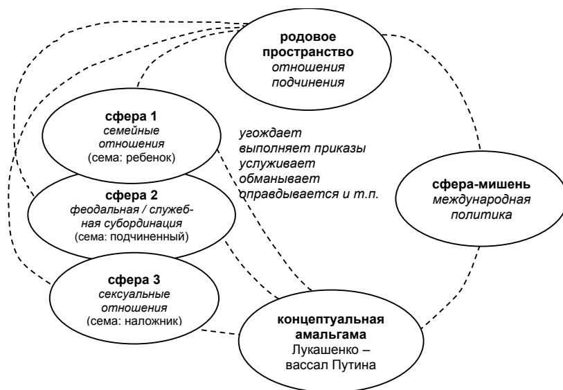
Схема 1. Концептуальная амальгама в мемах „Лукашенко – вассал Путина” (собственная разработка).

Нашей целью является выделение и описание основных слотов репрезентируемой интернет-мемами амальгамы „Лукашенко – вассал Путина”, учитывая связи данного метафорического конструкта с другими фрагментами коллективного когнитивного пространства. Сопоставление серии мемов, генерированных одной исходной политической ситуацией, позволяет выделить семантические компоненты, которые в процессе редупликации и трансформации мема остаются неизменными (подробнее: Belovodskaâ, 2014; Belovodskaâ, 2016, s. 126–127). Именно эти компоненты являются теми смысловыми элементами родового пространства, которые способствуют порождению амальгамного медиаобраза. В рассматриваемом нами случае породившая концептуальную амальгаму сема „подчинения, зависимости, угождения” эксплицируется посредством интеграции сферы политики с концептуальными пространствами других асимметричных (вертикальных) отношений (см. схему 1).