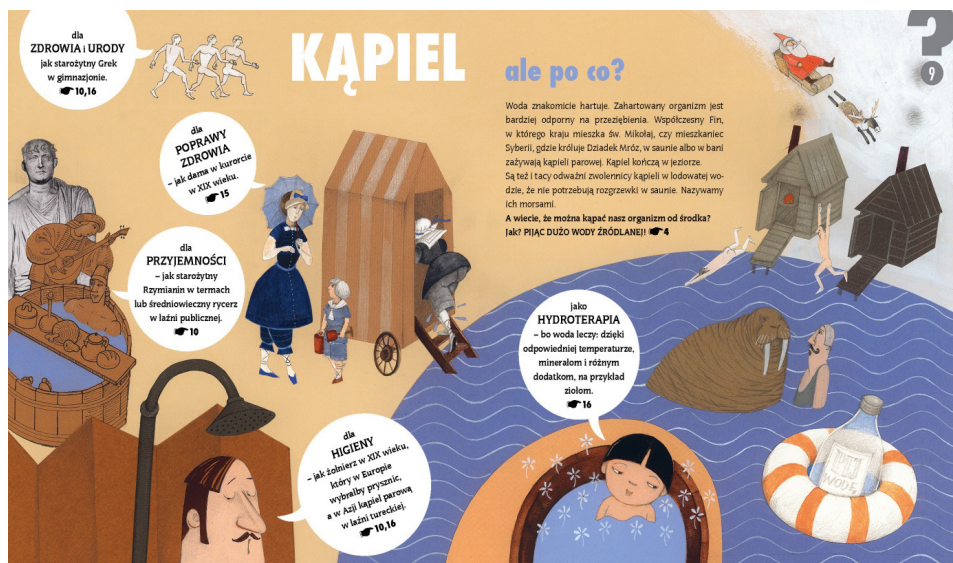
Rozkładówka książki obrazkowej Łazienkowe pytania

Rozpoznawalna stylistyka wizualna buduje tematycznie inną autorską książkę Krystyny Lipki-Sztaarbałło pt. Łazienkowe pytania . Podjęty temat jest bliski każdemu i chociaż często unikany, ma istotną wartość szczególnie na etapie kształtowania samodzielności w samoobsłudze, kształtowania nawyków pożądanых i akceptowanych społecznie w obrębie higienicznego zachowania się w toalecie i łazience. Tematyka ta jest naturalną dla dziecka, chociaż wielu dorosłych skłonnych jest do unikania „trudnego” tematu. Tymczasem książka jest doskonale skonstruowanym przewodnikiem obrazkowym, szczegółowo objaśnia i tłumaczy. Pomaga dorosłemu w pracy wychowawczej.