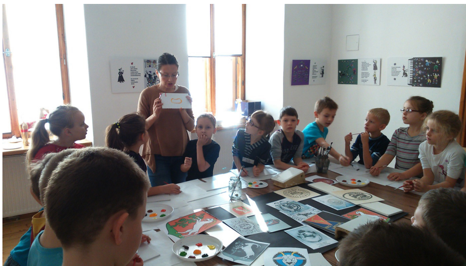
Dzieci na warsztach plastycznych przeprowadzonych w oparciu o książkę obrazkową Agnieszki Zawadzkiej Ballada o piecu kaflowym . W tle ekspozycja kart rozkładowych książki.