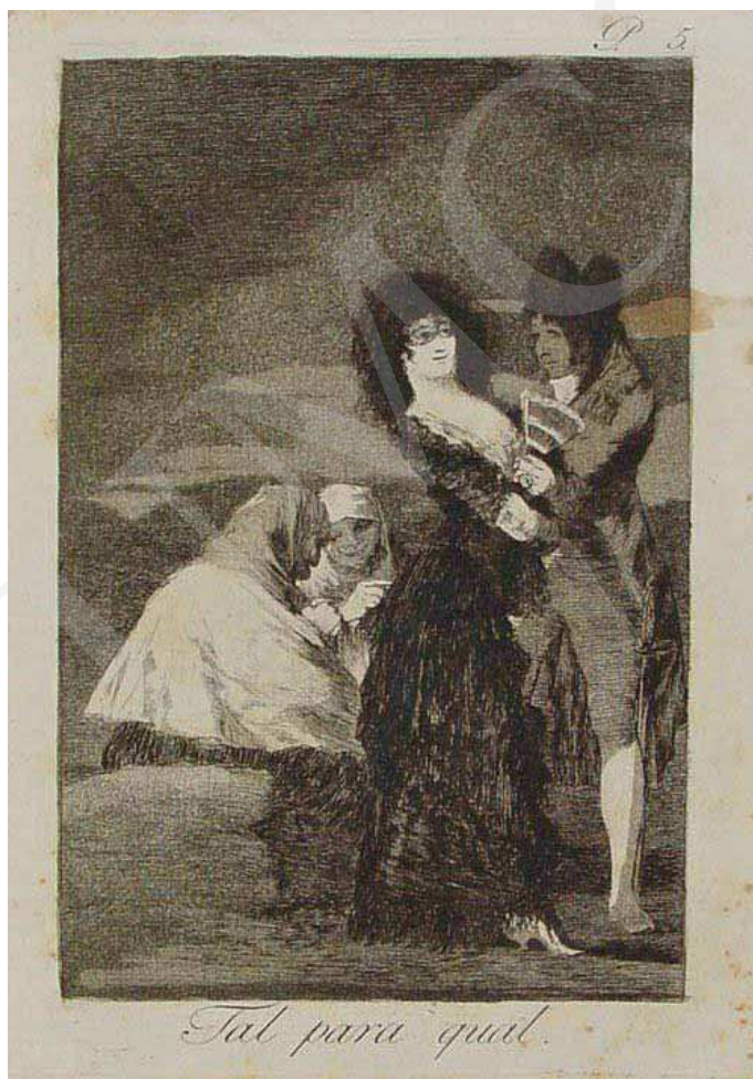
Ilustracja 1. F. Goya, Kaprys 5: Tal para qual , 1797-1798, akwaforta z akwatiną, 21,7cm x 15,2cm.