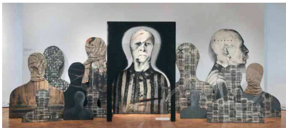
Ilustracja 4. J. Szajna, Reminiscence , źródło: https://muzeumslaskie.pl/pl/kalendarium/reminiscence-jozefa-szajny-panel-dyskusyjny [data dostępu: 25.10.2018].