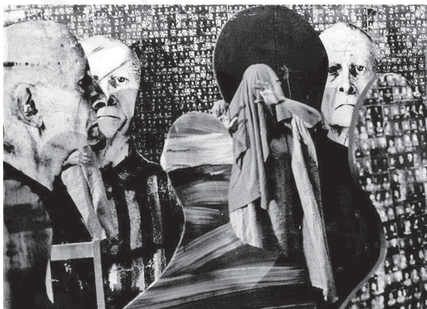
Ilustracja 3. J. Szajna, Sylwety i cienie , źródło: http://dmochowskigallery.net/galeria_zoom.php?artist=4&picture=3253 [data dostępu: 30.08.2018].