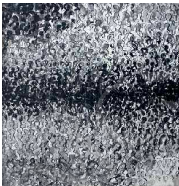
Ilustracja 2. J. Szajna, Mrowisko , źródło: https://www.artspier.com/en/contemporary-artworks/drawing/48589/from-the-series-mrowisko-ant-colony [data dostępu: 21.08.2018].