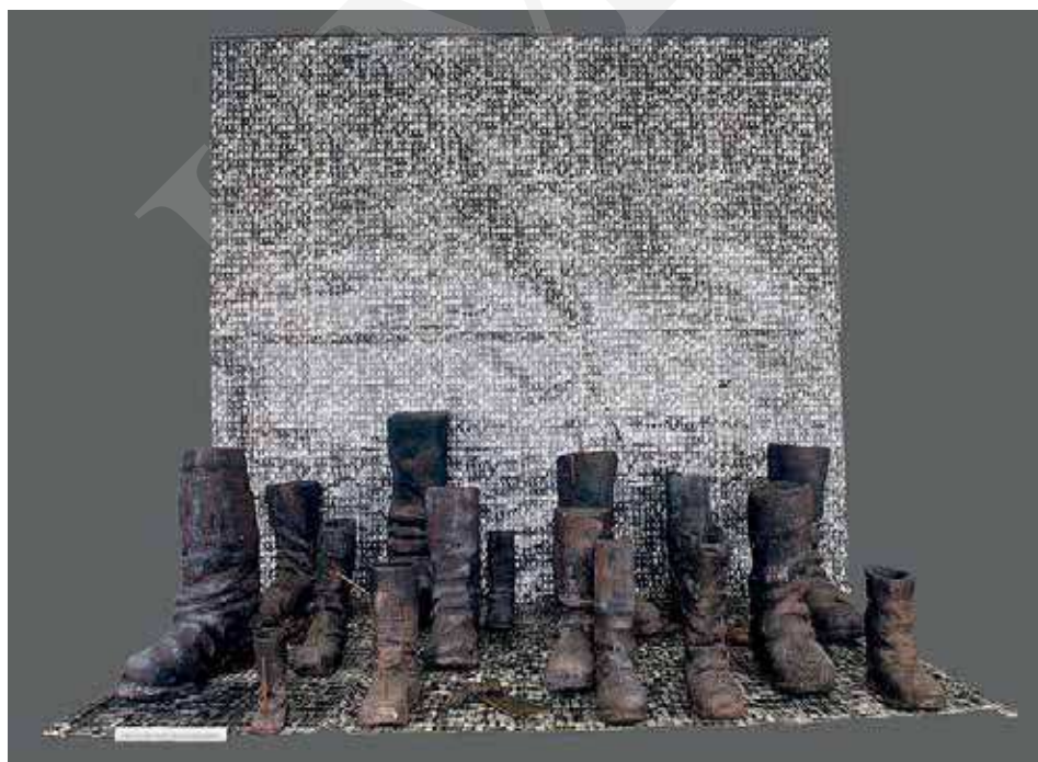
Ilustracja 5. J. Szajna, Drang nach Osten – Drang nach Westen , źródło: http://dmochowskigallery.net/galeria_zoom.php?artist=4&picture=3251 [data dostępu: 30.08.2018].