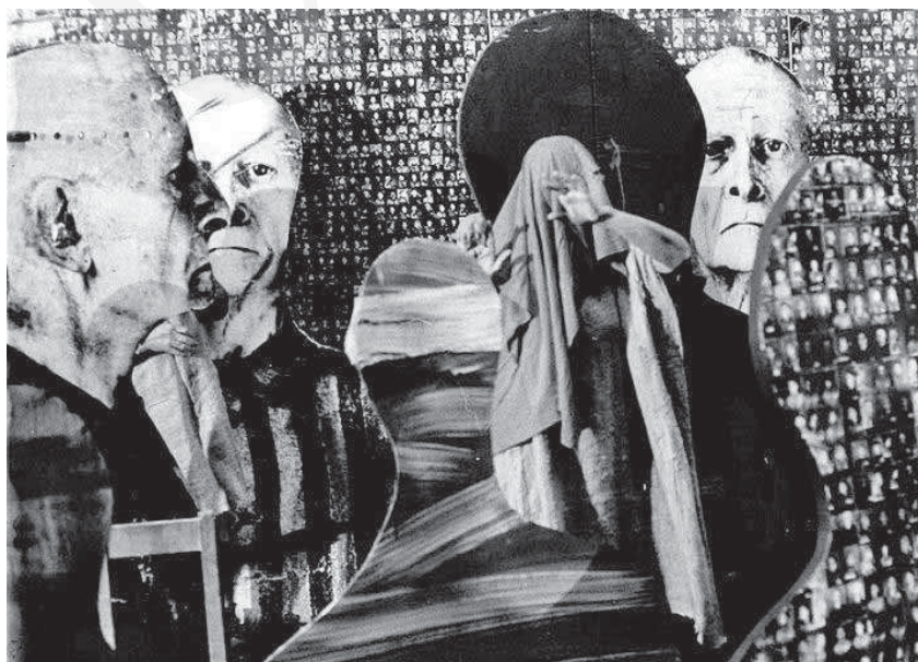
Ilustracja 3. J. Szajna, Sylwety i cienie