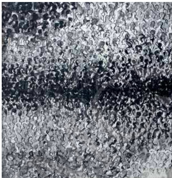
Ilustracja 2. J. Szajna, Mrowisko , źródło: https://www.artspier.com/en/contemporary-artworks/drawing/48589/from-the-series-mrowisko-ant-colony [data dostępu: 21.08.2018].