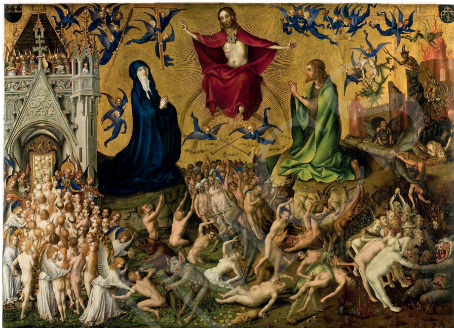
Ilustr. 1. Stefan Lochner, Sąd Ostateczny, ok. 1435

Patrząc wstecz, dostrzegamy, że każda epoka wytwarzała styl artystyczny najlepiej odbijający ówczesną wrażliwość, który – będąc stylem współczesnym – był także kontynuacją sztuki dawniejszej. Sztuka tradycyjna wskazywała nowemu pokoleniu, co ma robić. Te aspekty, które w sztuce przeszłości nie były podkreślone czy należycie wykorzystane, stawały się inspiracją dla następnego pokolenia. Przykłady nasuwają się same, np. koncepcje teologiczne w Sądzie Ostatecznym Stefana Lochnera z Katedry w Kolonii, gdzie ludzie zmartwychwstają prosto ze swoich ziemskich grobów, a z drugiej strony Pogrzeb hrabiego Orgaza pędzla El Greco, gdzie dusza niedawno zmarłego Don Gonzalo Ruiza z Toledo pojawia się w ramionach anioła w postaci delikatnie zarysowującego się „obłoku”.