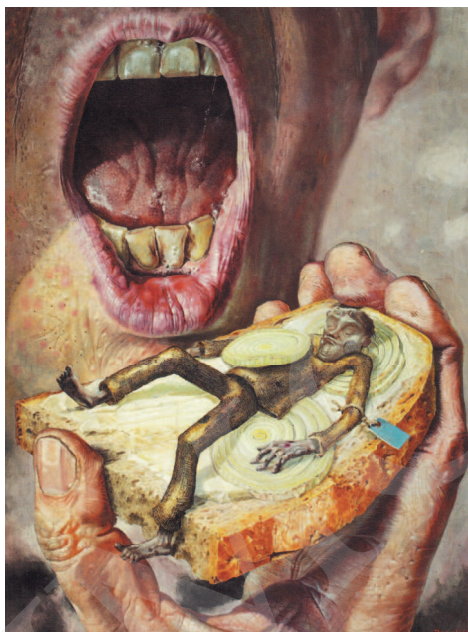
Ilustracja 2. B. W. Linke, Kanibalizm , 1950-1951, olej na płótnie, 100cm x 74cm.