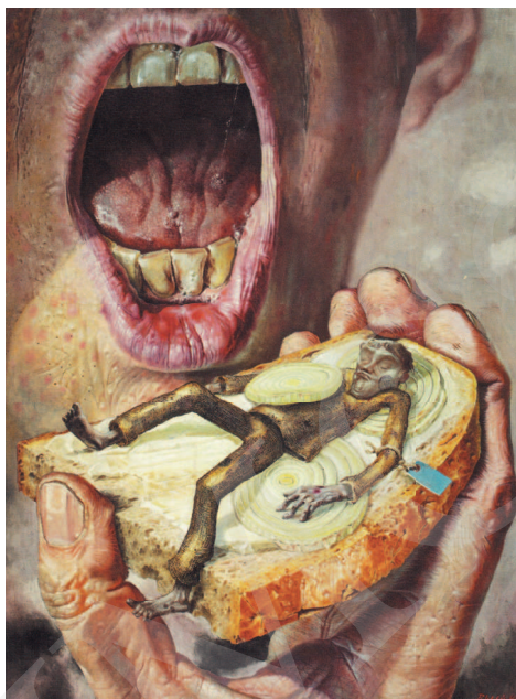
Ilustracja 2. B. W. Linke, Kanibalizm , 1950-1951, olej na płótnie, 100cm x 74cm.