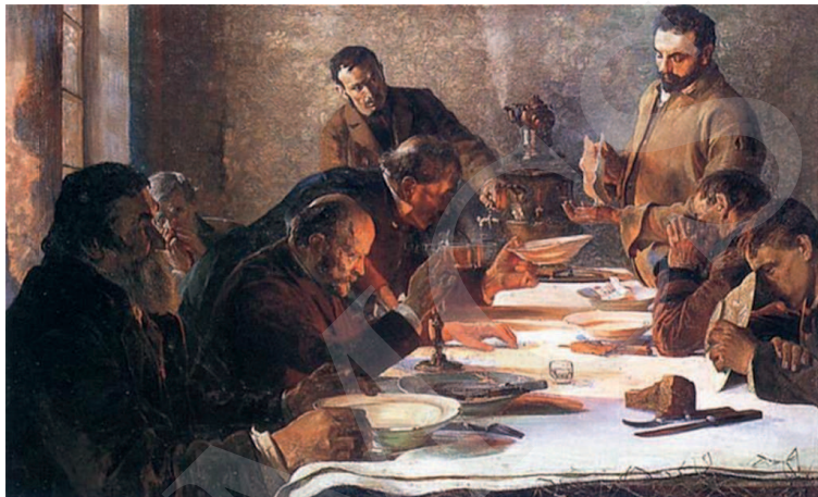
Ilustracja 1. J. Malczewski, Wigilia na Syberii , 1892, wymiary: 81cm x 126cm.

Ten narodowy, fundamentalny dla sztuki Malczewskiego aspekt widzimy również w cyklu obrazów związanych z Syberią – Na etapie. Sybiracy (1890), Sybiracy (1891) i Wigilia na Syberii (1892) 15 . Ostatni z nich zainspiruje Kaczmarskiego.