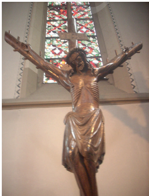
Ilustracja 12. Krucyfiks z kościoła św. Sykstusa w Haltern.