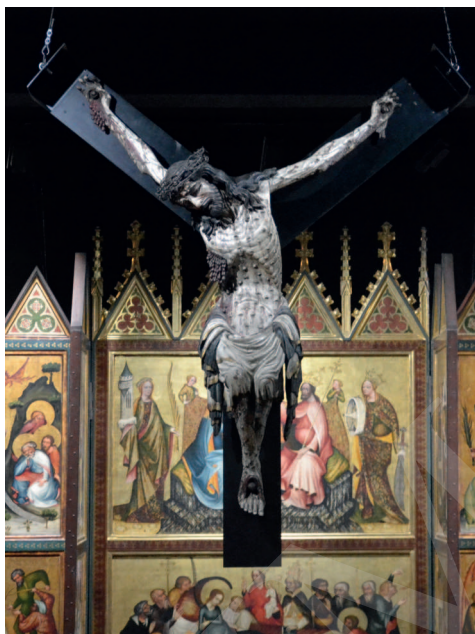
Ilustracja 1. Krucyfiks z kościoła Bożego Ciała we Wrocławiu, Ekspozycja Galerii Sztuki Średniowiecznej w Muzeum Narodowym w Warszawie.