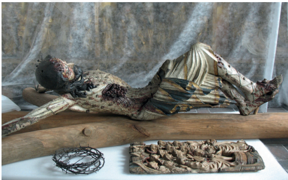
Ilustracja 6. Krucyfiks z kościoła Bożego Ciała we Wrocławiu, Ekspozycja Galerii Sztuki Średniowiecznej w Muzeum Narodowym w Warszawie.