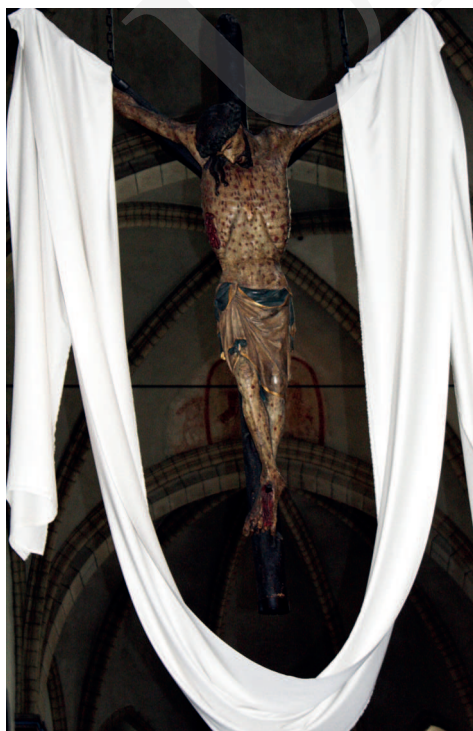
Ilustracja 16. Krucyfiks z kościoła św. Seweryna w Kolonii.