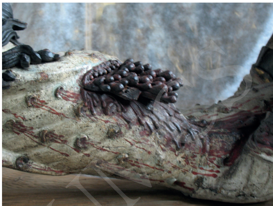
Ilustracja 7. Krucyfiks z kościoła Bożego Ciała we Wrocławiu, Ekspozycja Galerii Sztuki Średniowiecznej w Muzeum Narodowym w Warszawie.