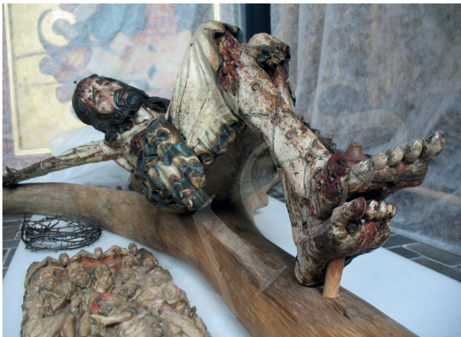
Ilustracja 5. Krucyfiks z kościoła Bożego Ciała we Wrocławiu, Ekspozycja Galerii Sztuki Średniowiecznej w Muzeum Narodowym w Warszawie.