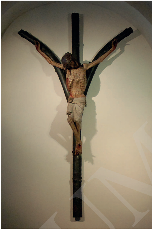
Ilustracja 11. Krucyfiks z kościoła Najświętszej Marii Panny na Kapitulu w Kolonii.