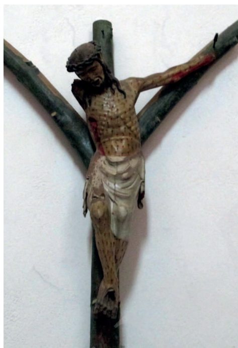
Ilustracja 15. Krucyfiks z kościoła św. Dominika w Orvieto.