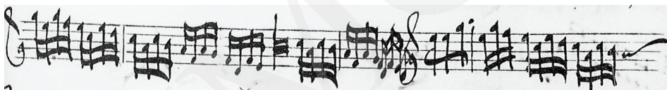
Ilustracja 3. Adam Jarzębski, Diligam te Domine , t. 36-39. Slg Bohn Ms. mus. 111, Prima vox, k. 3v.