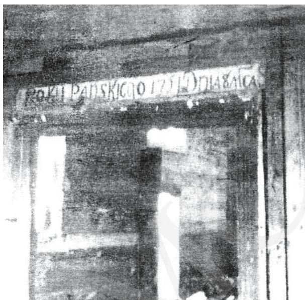
Il. 4. Michale – inskrypcja na nadprożu. Repr. z: O. Хведів, На кручі Бугу (Свято-Введнська церква села Михале). Історико-краєзнавчий нарис , Луцьк 2002, s. 11.