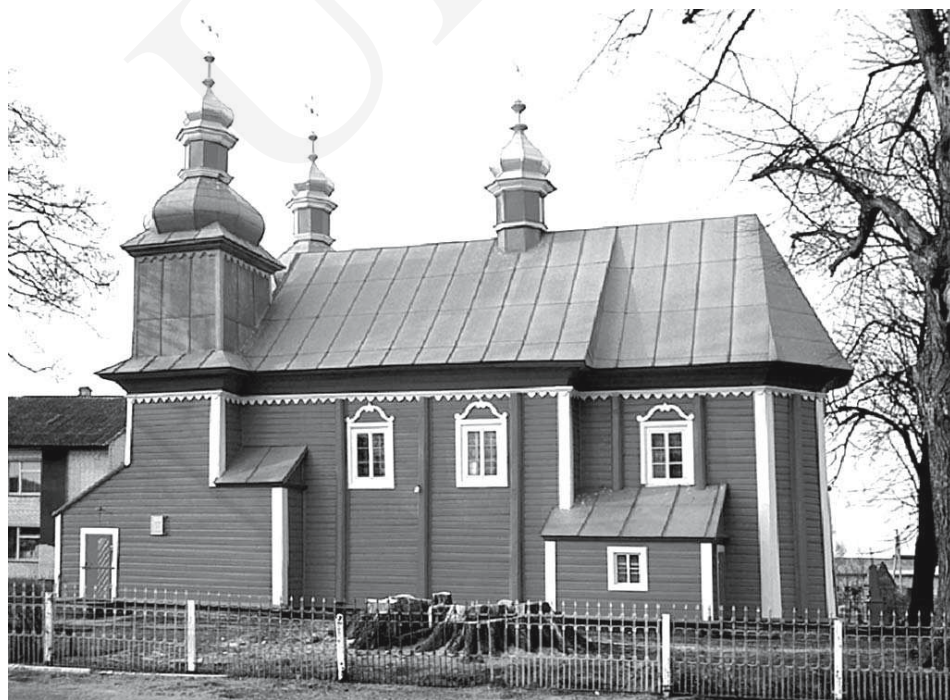
Il. 5. Olble Ruskie na Wołniu (obecnie: Грудки) – unicka cerkiew dwuwieżowa z 1771 roku.