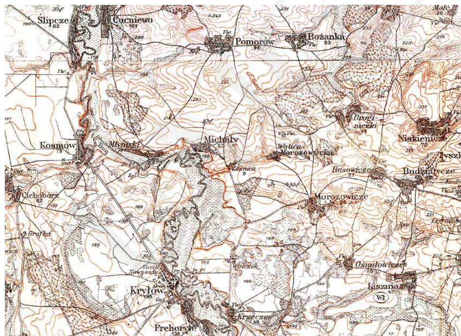
Il. 1. Michale i okolice, fragment mapy Karte des westlichen Russlands , 1915 r., 1 : 100 000, Gruppe III, 0/38, 0/39 [Biblioteka Regionalnego Ośrodka Studiów i Ochrony Środowiska Kulturowego w Lublinie].