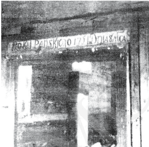
Il. 4. Michale – inskrypcja na nadprożu. Repr. z: O. Хведів, На кручі Бугу (Свято-Введнська церква села Михале). Історико-краєзнавчий нарис , Луцьк 2002, s. 11.