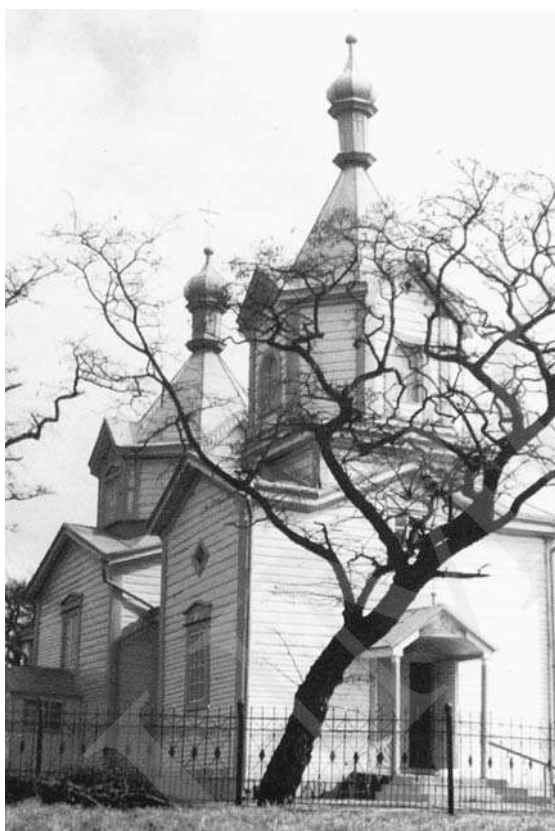
Il. 2. Michale – cerkiew, fot. М. Коц. Репр. з: Л. Бабич, В. Свистун, Храми Волині , Луцьк 2004, s. 36.