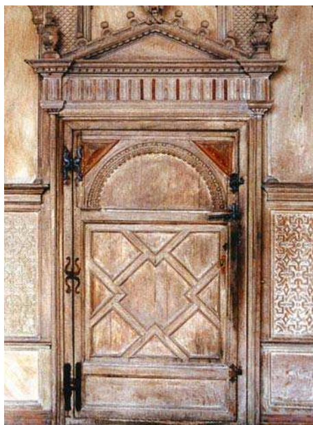
Il. 10. Haddon Hall , drzwi w Long Galery.