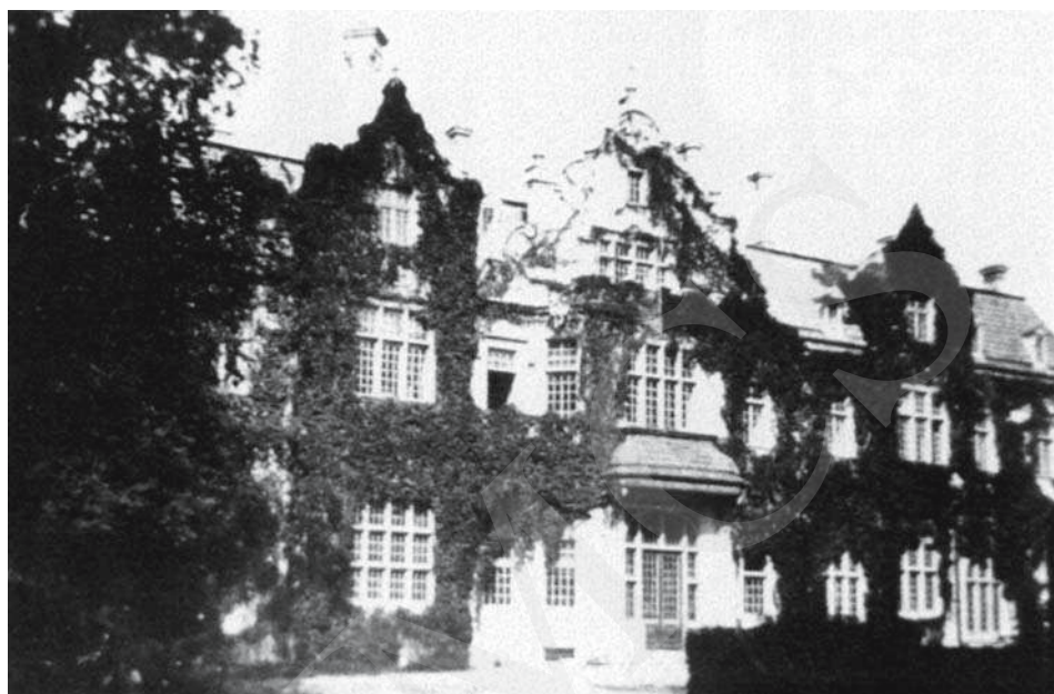
Il. 3. Pałac w Jabloniu, elewacja ogrodowa. 1935.