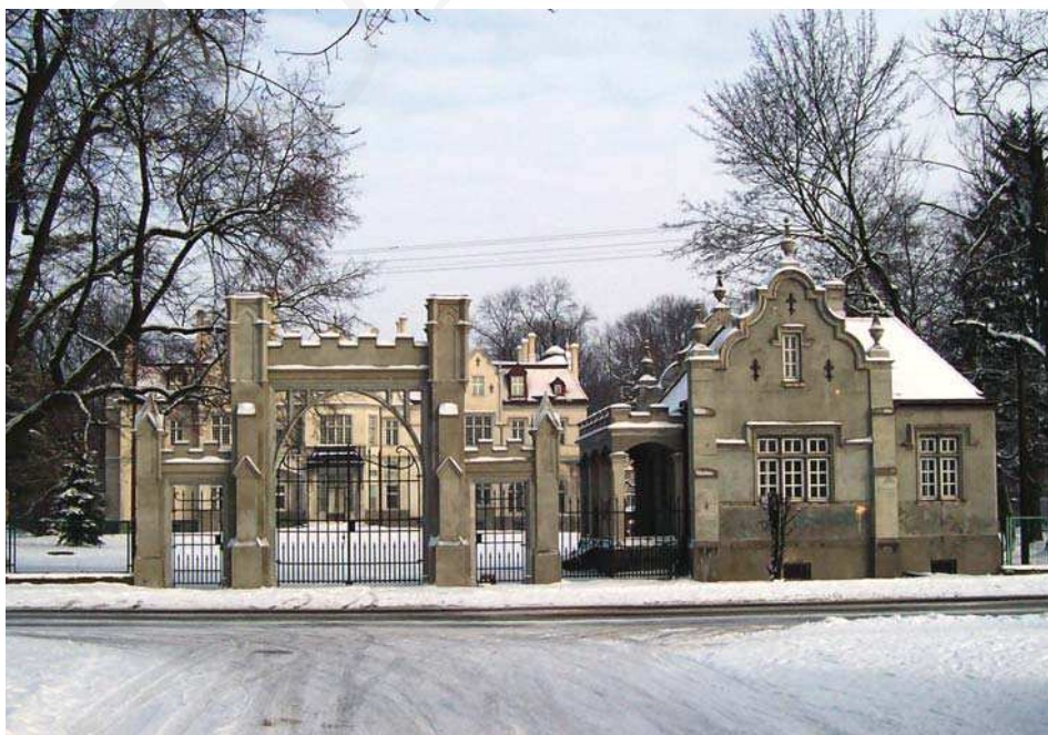
Il. 2. Pałac w Jabłoni, brama wjazdowa i kordegarda, w głębi pałac. Fot. A. Cebulak, luty 2005.