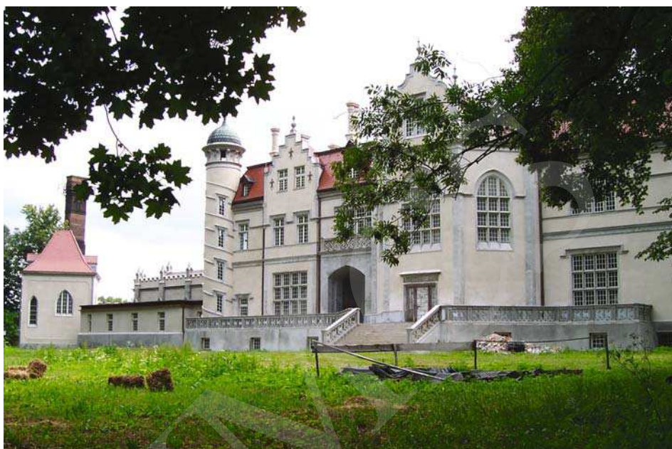
Il. 5. Pałac w Jabłoni, elewacja ogrodowa. Fot. A. Cebulak, lipiec 2006.