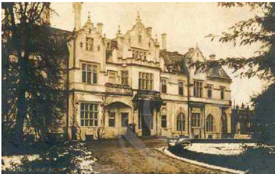
Il. 1. Pałac w Jabłoni, najstarszy znany widok z austriackiej widokówki z 1915 roku.