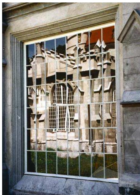
Il. 7. Pałac w Jabłoniu, okno w łączniku pomiędzy pałacem a oficyną. Fot. A. Cebulak, sierpień 2005.