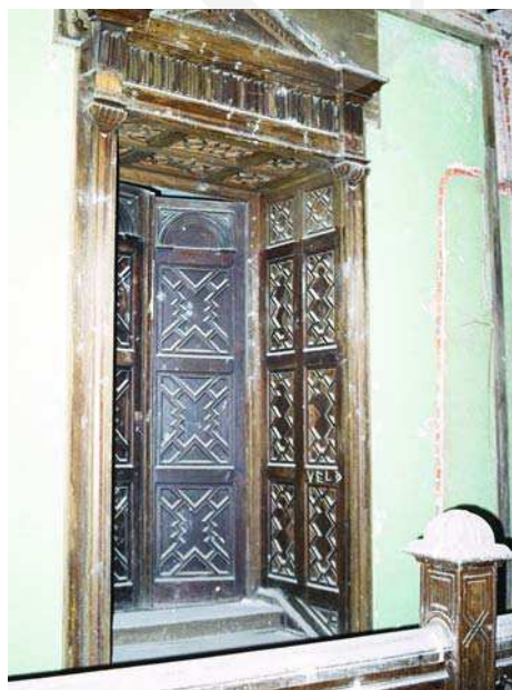
Il. 9. Pałac w Jabłoniu, drzwi na antresoli hallu. Fot. A. Cebulak, listopad 2008.