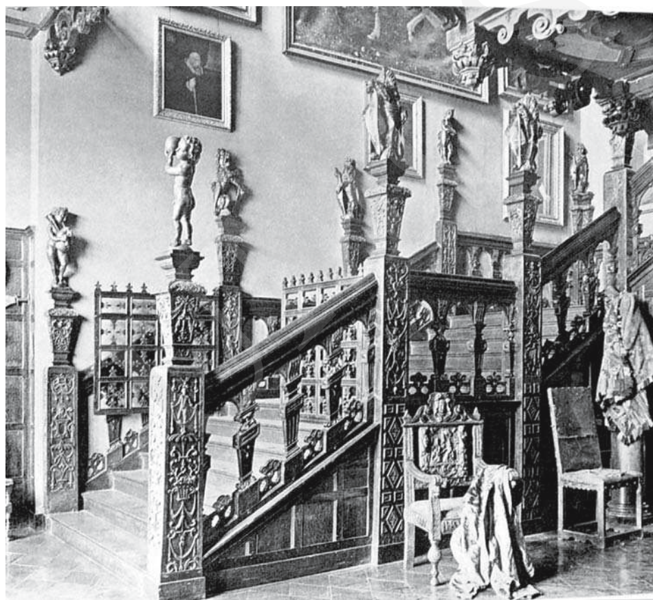
Il. 13. Hatfield House , klatka schodowa. Repr. z: Ch. Latham, In English Homes , Coventry 1904, s. 113.