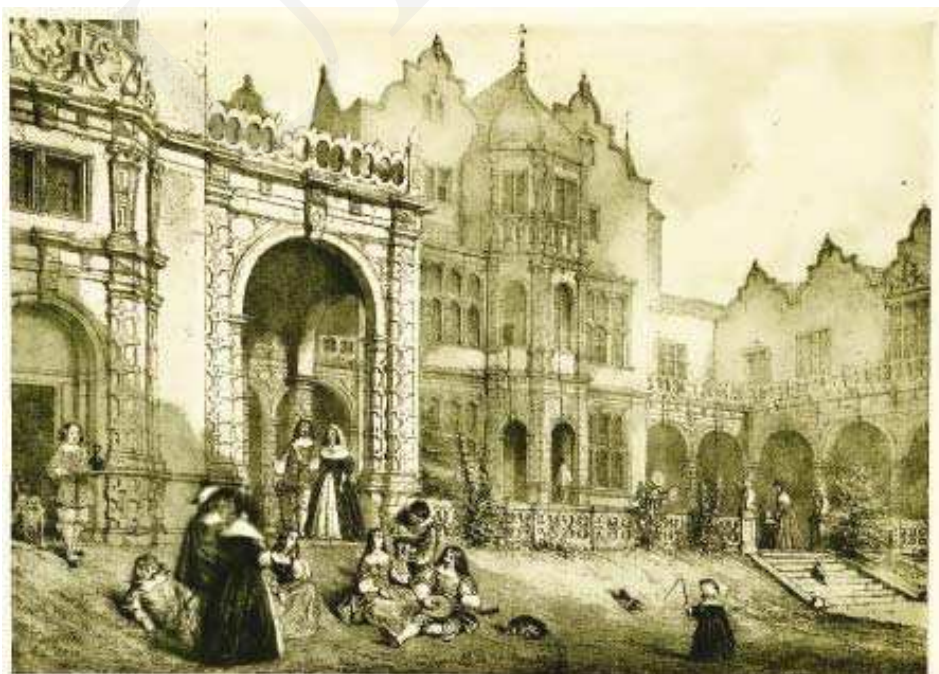
Il. 6. Holland House (Kensington).