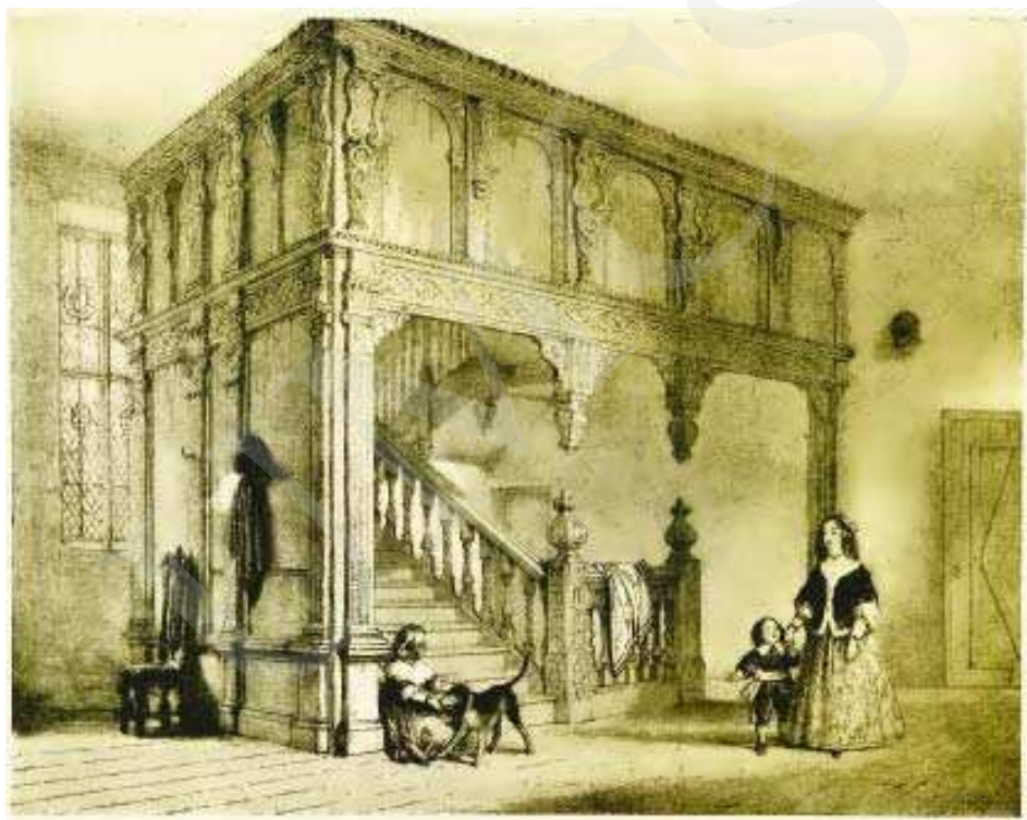
Il. 14. Wakehurst (Sussex). Repr. z: J. Nash, The Mansions of England in the Olden Time , New York 1912, ryc. 98.