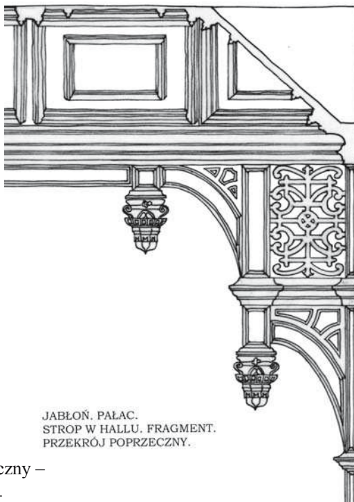
JABŁOŃ. PAŁAC. STROP W HALLU. FRAGMENT. PRZEKRÓJ POPRZECZNY.