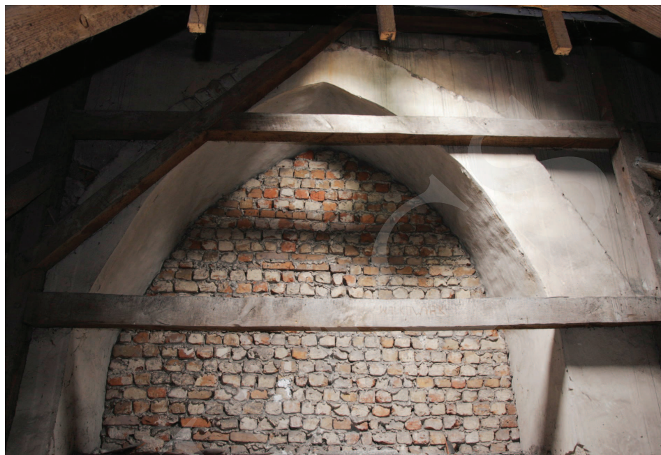
Ilustracja 6. Kościół farny we Wrześni – widok z poddasza nawy południowej na gotycką arkadę międzynawową