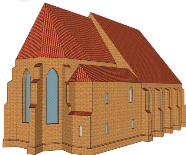
Ilustracja 9. Rekonstrukcja bryły kościoła farnego we Wrześni z aneksem emporowym, przed dobudowaniem wieży. Widok od północnego wschodu, oprac. W. Miedziak