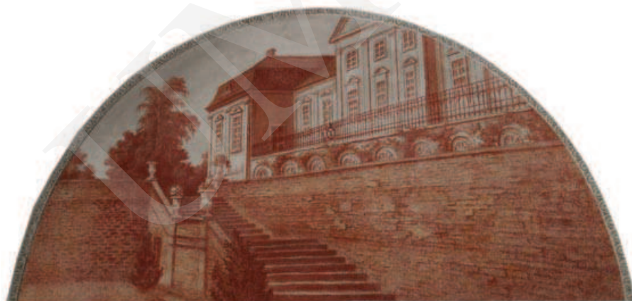
Ilustracja 5. Taras przypałacowy – malowidło z pałacu w Adampolu.