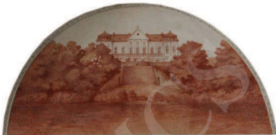
Ilustracja 4. Widok na pałac od doliny Bugu – malowidło w pałacu w Adampolu.