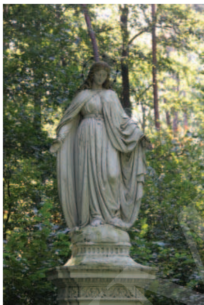
Ilustracja 14. Figura NMP Niepokalnego Poczęcia dłuta Konstantego Hegla, niegdyś w Różance obecnie w Adampolu.