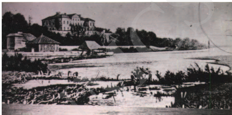
Ilustracja 2. Reprodukacja malowidła ściennego w pałacu w Adampolu. Stan pałacu w Różance po I wojnie światowej.

W roku 1972 wydano dokument o przekazaniu prawie 9 ha obejmujących park w Różance na Muzeum Wsi Lubelskiej, jednak decyzja ta nigdy nie weszła w życie, a tereny pozostały do dyspozycji Urzędu Gminy. Przez pewien okres urządzano na terenie parku obozy harcerskie i kolonie, a w latach 70. XX wieku na południowym obrzeżu założenia rozpoczęto budowę Domu Spokojnej Starości oraz budynków mieszkalnych 23 .