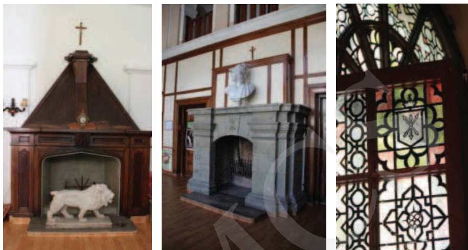
Ilustracja 7. Kominki oraz witraże w kaplicy w Adampolu – elementy przeniesione z pałacu w Różance.