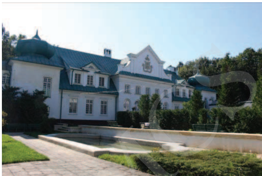
Ilustracja 12. Pałac w Adampolu.