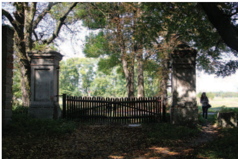
Ilustracja 9. Filary bramy w Różance.