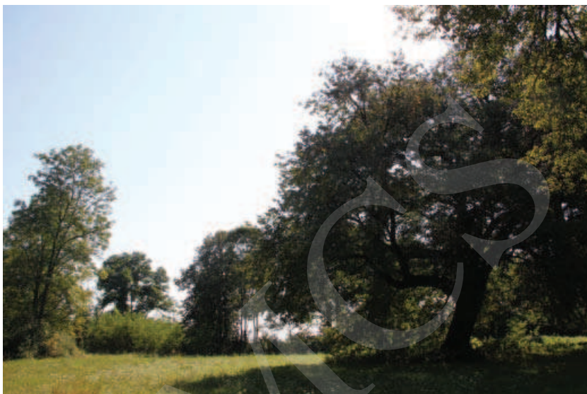
Ilustracja 10. Fragment parku w Różance.