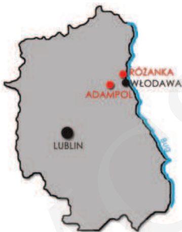
Ilustracja 1. Lokalizacja zespołu pałacowego w Różance i Adampolu na tle aktualnych granic Województwa Lubelskiego, 2014 (oprac. M. Boguszewska)