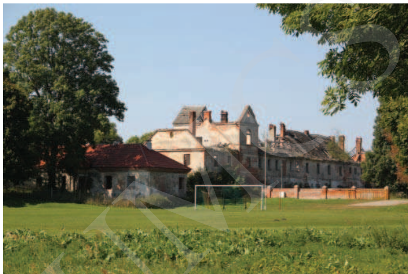
Ilustracja 8. Pozostałości zabudowań w Różance.

Obecny właściciel dokłada wszelkich starań, by całość założenia w Adampolu była zadbana i przechodziła konieczne remonty. Budynek towarzyszący niegdyś pałacowi (leśniczówki, dom gajowego) w chwili obecnej zostały zaadaptowane na pomieszczenia administracyjne oraz budynki mieszkalne.