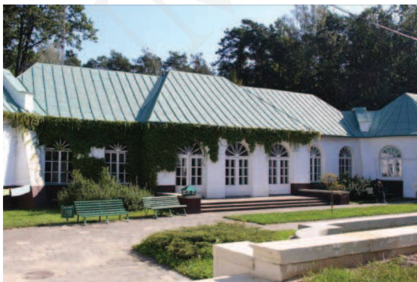
Ilustracja 13. Budynek oranżerii – zespół pałacowy w Adampolu.