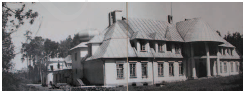
Ilustracja 6. Widok na główną elewację zewnętrzną pałacu w Adampolu.

Na wniosek Wojewódzkiego Wydziału Zdrowia w 1946 roku pałac w Adampolu wraz z przylegającymi gruntami przekazano dla potrzeb sanatorium przeciwgruźliczego, co wiązało się z przebudową i dostosowaniem budynków zespołu 33 . Obecnie park pałacowy, położony w lasach dębowo-sosnowych, liczy około 1,5 ha 34 .