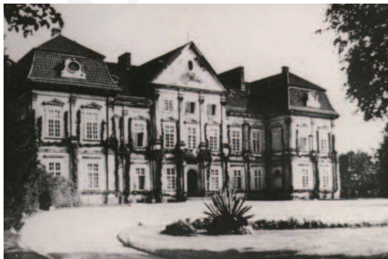
Ilustracja 3. Różanka, zachodnia elewacja pałacu. Stan z początku XX wieku. (Fot. w zbiorach p. Paprockiej, [za:] A. Obrębka, op. cit. )