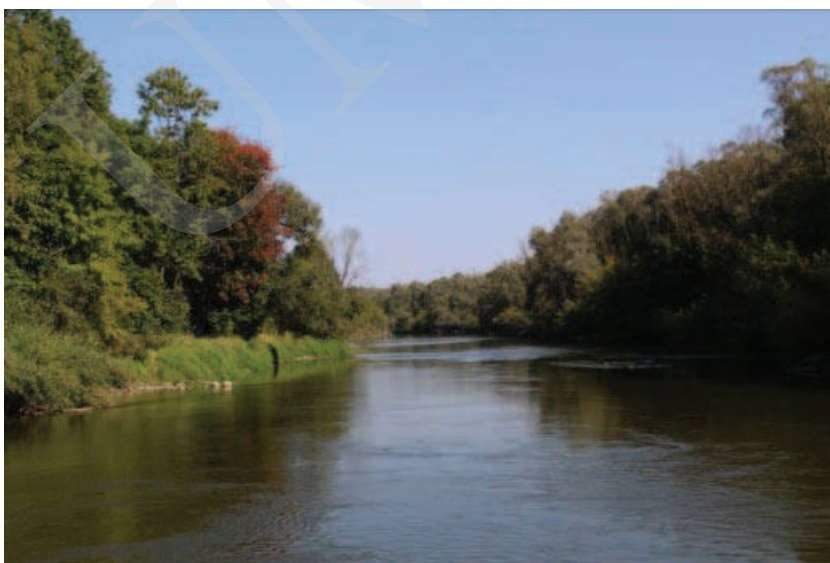
Ilustracja 11. Wschodnia granica parku w Różance – Bug.