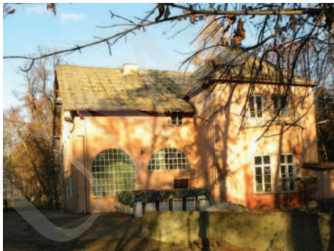
Ilustracja 3. Budynek pałacu – elewacja południowa, fot. M. Dudkiewicz (2012).

Ogólna inwentaryzacja architektoniczna przeprowadzona w 2012 roku (zob. il. 3-6) wykazała, że budynek z roku 1881 jest w stanie ruiny. Obiekt ten był wzniesiony na planie prostokąta, z dachem dwuspadowym, ścianami wykonanym z cegły i opoki wapiennej, naprożami okien ceglany i łukowymi. W sąsiednim budynku – suszarni – jest zachowane deskowanie więźby dachowej, w kształcie koperty, z zewnątrz dach dwuspadowy. W magazynie układ dachu płatwiowo-kleszczowy, kleszcze w przekroju okrągłym, z bali. Strop opiera się na drewnianych słupach, ściany murowane z cegły dziurawki. Dach nakryty eternitem z zaakcentowanymi narożnikami.