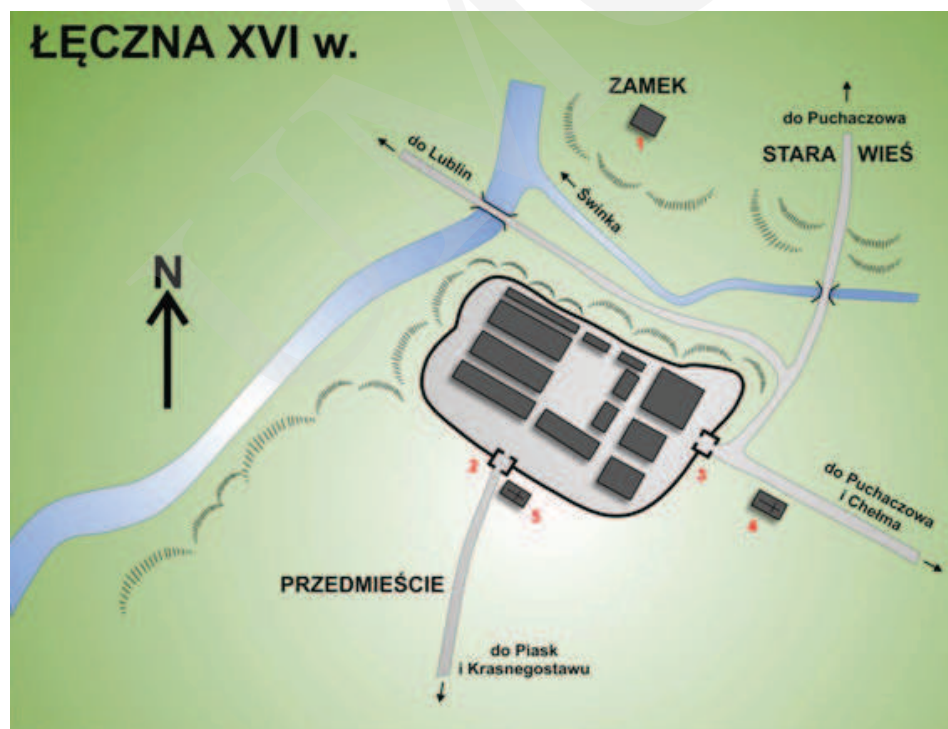
Ilustracja 1. Rekonstrukcja układu przestrzennego miasta Łęczna w XVI wieku. 1 – Zamek; 2 – Brama Krasnostawska; 3 – Brama Chełmska; 4 – Kościół parafialny; 5 – Kościół szpitalny Św. Ducha, oprac. M. Dudkiewicz, wg Maciuka, [w:] Łęczna. Studia z dziejów miasta , red. E. Horoch, Łęczna 1989, s. 38.

Pierwsza wzmianka o Łęcznej – z pisownią Laczna – pochodzi z 1252 roku. Była to wówczas własność opactwa sieciechowskiego, a później, w roku 1428, Stefana z Łęcznej. Ziemie łączyńskie leżały na granicy wpływów Małopolan, pomiędzy województwem chełmskim i Księstwem Halicko-Wołyńskim, co prawdopodobnie było przyczyną wzniesienia na skraju wysokiego ujścia Świnki do Wieprza zamku obronnego 1 (zob. il. 1). 7 stycznia 1467 roku Kazimierz Jagiellończyk nadał Łęcznej prawa miejskie. Miasto osadzono na 36 łanach na skrzyżowaniu dwóch szlaków handlowych: z Wołunia do Lublina, i z Podkarpacia na Podlasie 2 .