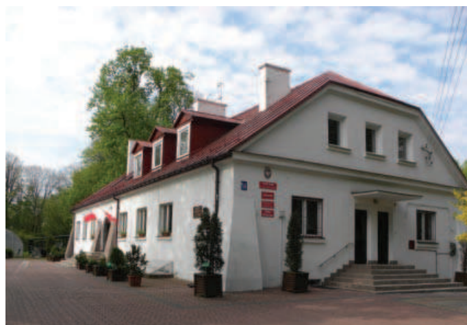
Ilustracja 4. Budynek dworu – elewacja północna, fot. M. Dudkiewicz (2012).