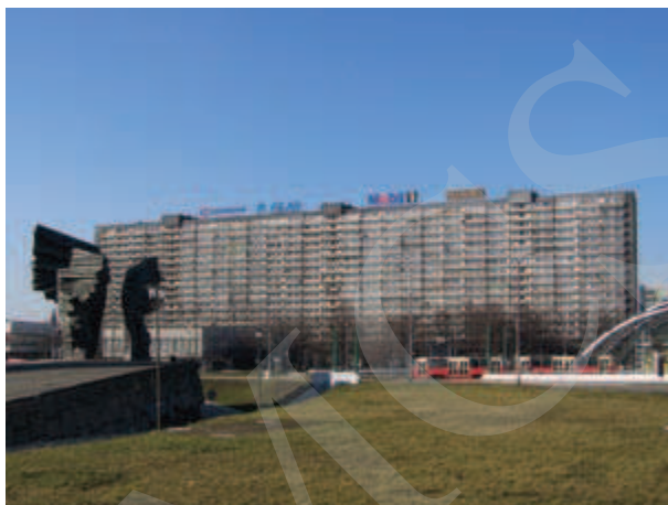
Ilustracja 13. Superjednostka w Katowicach 24 .

cają się widokami z okien na Beskidy, a przy dobrej przejrzystości powietrza – nawet na Tatry 23 .