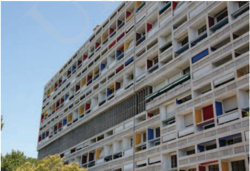
Ilustracja 3. Elewacja Jednostki Marsylskiej, Marsylia, fot. K. L. Boguszewska (2012).