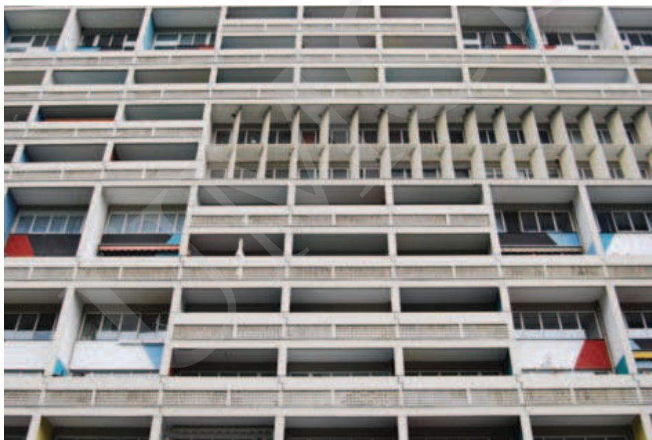
Ilustracja 11. Relief elewacji Jednostki Berlińskiej, fot. A. Pilip (2010).

Jednostka Berlińska posiada podobny, jakkolwiek znacznie zubożony schemat funkcjonalny; także i tu Le Corbusier zaprojektował pasaż handlowy dla mieszkańców. Do dzisiaj w budynku jednostki funkcjonują poczta i dostępny dla turystów hotel. Budynek ten, podobnie jak wszystkie inne realizacje szwajcarskiego architekta, przyciąga rzesze zwiedzających. Rozrzeźbiona elewacja i łamacze słońca ( brise soleil ) zastosowane w Berlinie przypominają wprawdzie realizację z południa Francji, równocześnie jednak przyjęte rozwiązania wydają się nieadekwatne do poziomu i natężenia insolacji w tym rejonie Europy (il. 11, 12).