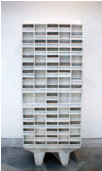
Ilustracja 2. Model Jednostki Marsylskiej na Biennale Architektury w Wenecji, wystawa w Arsenale, fot. K. L. Boguszewska (2010).