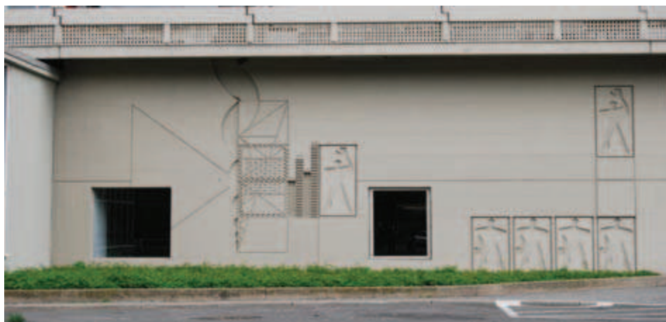
Ilustracja 12. Modułor na elewacji Jednostki Berlińskiej, fot. A. Pilip (2010).