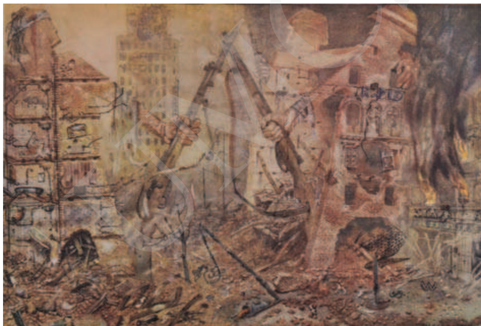
Ilustracja 3. Bronisław Wojciech Linke, Domy-żołnierze , 1947, z cyklu Kamienie krzyczą .

prace z cyklu Kamienie krzyczą 25 wystawiło Muzeum Narodowe w Warszawie już w 1948 roku, w tym m.in. obraz Domy-żołnierze – gdzie „domy rozdarte bombami otworzyły swoje wnętrza, ekshibicjonistycznie ukazując nie tylko dramat, ukazały rzeczy dotąd ukryte” 26 . Kompletny cykl powstający przez dziesięć lat (1946-1956) tworzy czternaście obrazów, spośród których w szczególny sposób uderzają swoją wymową Getto niezłomne , Egzekucja na ruinach Getta , El mole rachmim , Domy-żołnierze oraz Misterium 27 . Porażająca wizja ruin stolicy ukazana została przez Linkego w specyficznych kształtach kamienic uformowanych na kształt ludzkich postaci, o wręcz monstrualnych rozmiarach, pozbawionych realizmu.