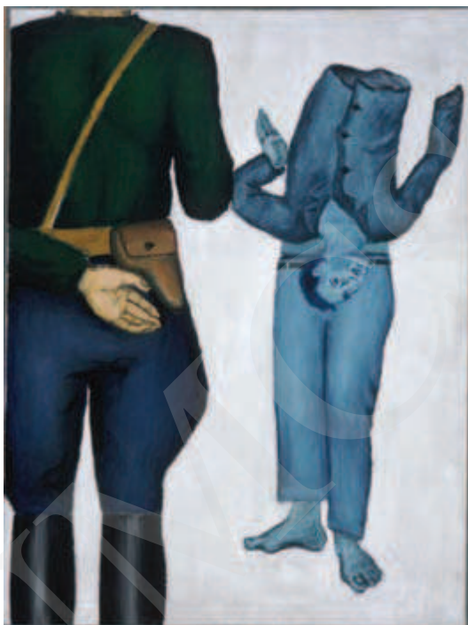
Ilustracja 5. Andrzej Wróblewski, Rozstrzelanie z esesmanem , reprodukcja [za:] B. Banaś, Andrzej Wróblewski , Warszawa 2006, s. 34.

Kolejne pozycje cyklu – Rozstrzelanie surrealistyczne , Rozstrzelanie na ścianie , Rozstrzelanie z chłopczykiem czy Rozstrzelanie rodziny – ujmują motyw śmierci w podobnej stylistyce. Obrazy działają na odbiorcę bardzo silnie. Choć nigdzie nie widzi się kropli krwi i dramatycznej grozy, płótna przyciągają wzrok. Są nad wyraz czytelne w swojej wymowie, jednocześnie zmuszają do przemyśleń. Wróblewski wykorzystywał obraną przez siebie symbolikę barw, postacie ukazywał anonimowo, w wizji statycznej, i m.in. przez to, jak mówił Witold Damasiewicz, unaoczniał „powolne odbieranie człowiekowi człowieczeństwa i nakazywanie mu stawania się rzeczą” 31 .