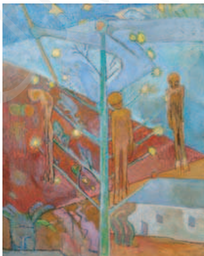
Ilustracja 8. Xawery Dunikowski, Boże Narodzenie w Oświęcimiu 1944 , 1950, Muzeum Narodowe, Kraków.

Dramat pobytu w obozie oświęcimskim uwidocznili w swoich pracach również Xawery Dunikowski (1875-1964) 39 . Rysunki wykonywane przez artystę w obozowej stolarni, a także dzieła wielkoformatowe powstałe już po wojnie, oddają jego przeżycia. Symboliczna wizja obozowych doświadczeń widoczna jest na wielu jego płótnach, takich jak Orkiestra , Ruszty czy Droga do wolności oraz – szczególnie znany – Boże Narodzenie w Oświęcimiu w 1944 roku . Obraz ten – o kolorystyce pastelowej, choć w barwach zimnych – przedstawia choinkę, a na niej wiszące zwłoki zamiast ozdób. W tej brutalnej deformacji tematyki świątecznej dojmująco odzywają się zmagania z obozową gehenną: