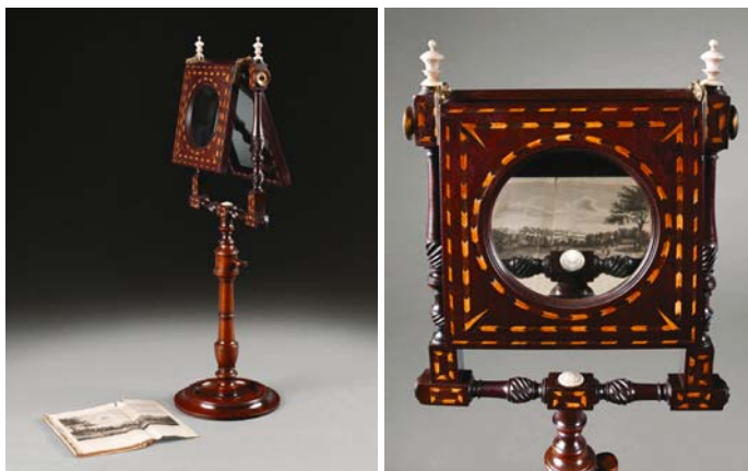
Ilustracje 1 i 2. Zograscope , model salonowy, Anglia, ok. 1770, obecnie w zbiorach Muzeum Pałac w Wilanowie.

Zograscope to zadziwiające urządzenie optyczne, stworzone do generowania „wirtualnych obrazów 3-D”. Wizualizują się one w okulusie zograscope . Nie można ich jednak sfotografować przestrzennie, w trójwymiarowej postaci bowiem istnieją tylko w postrzeżeniu widzów. Przy czym nie są to wizje o charakterze marzeń sennych, hipnozy czy halucynacji, bo natura ich pochodzenia jest techniczna. Źródłem inicjującym ich wywoływanie jest działanie optycznej maszyny zograscope .