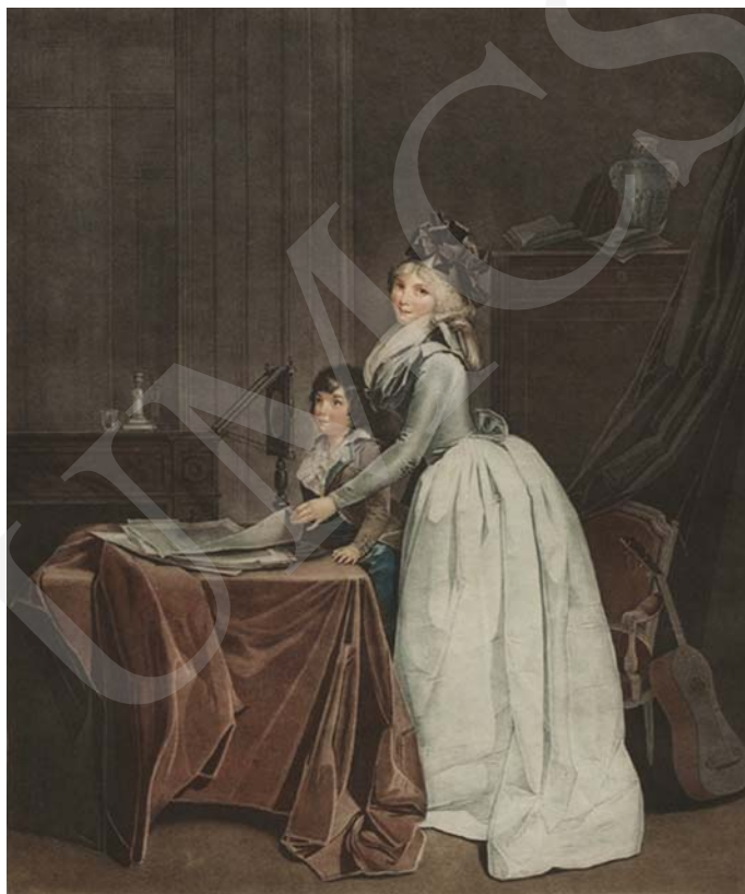
Ilustracja 3. Louis Leopold Boilly (1761-1845), L'optique .

ne zespolone są korpusem, który wynosi je ponad powierzchnię ekspozycji grafiki na około 45 cm 3 . Dzięki temu osoba siedząca przy stole patrzyła na wprost przez obiektyw na lustrzane odbicie grafiki leżącej płasko na blacie w zasięgu jej ręki, co jest najkorzystniejsze z punktu widzenia skuteczności działania optyki urządzenia i ułatwia przekładanie kolejnych obrazów (zob. il. 3).