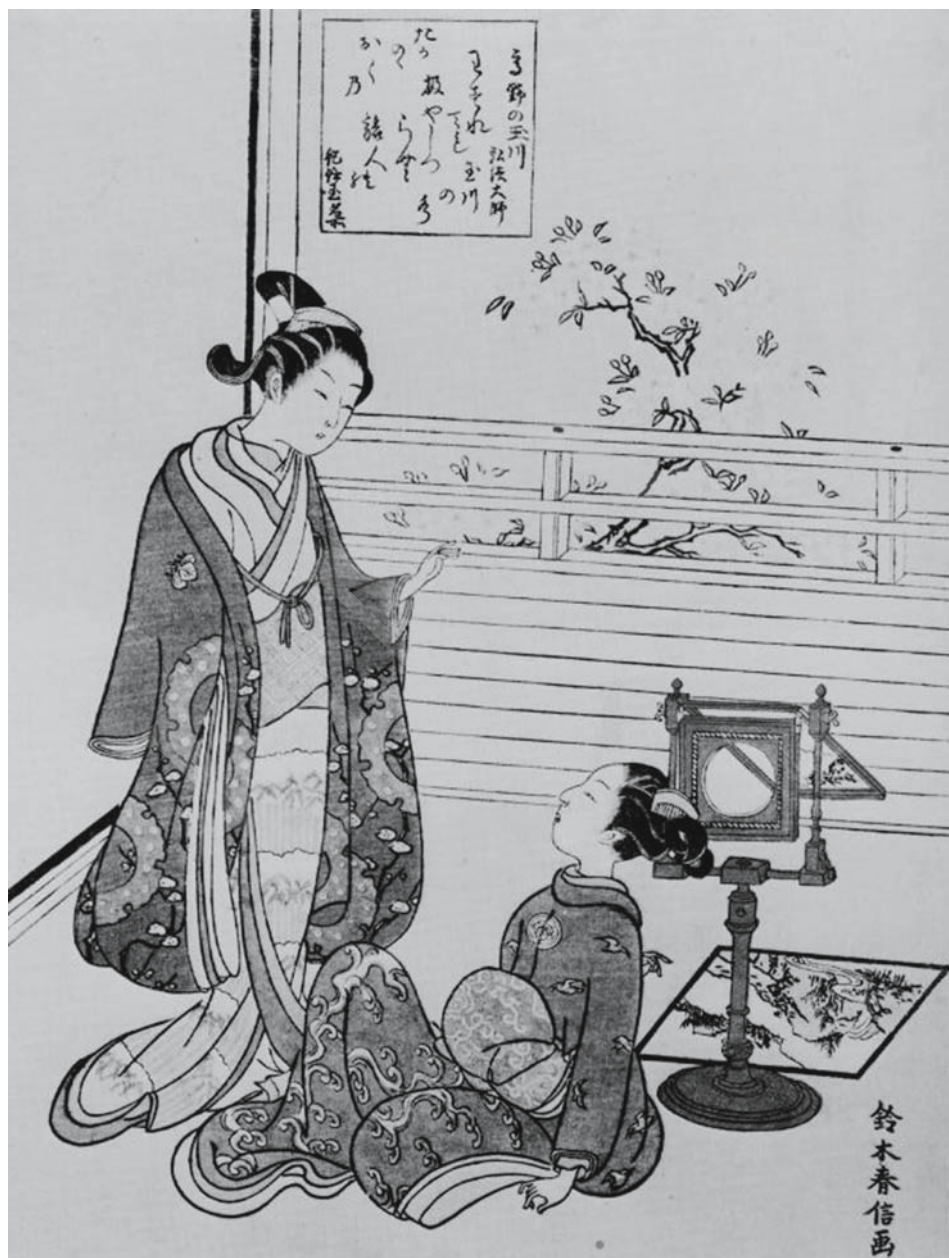
Ilustracja 11. Suzuki Harunobu (1725?-1770), Dwie piękne dziewczyny z zograscopes , drzeworyt koniec lat 1760(?).