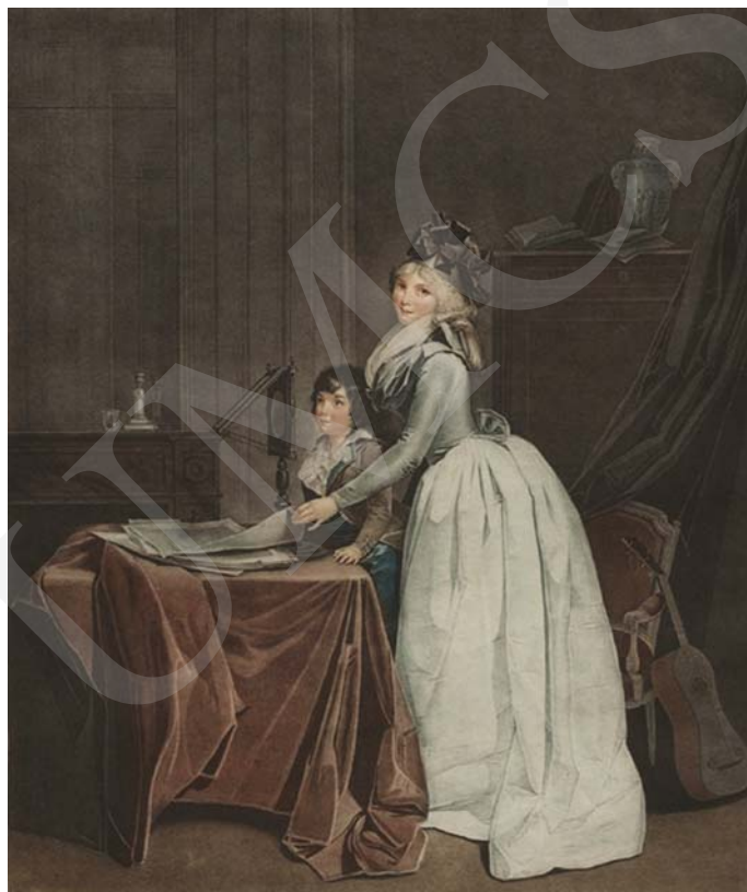
Ilustracja 3. Louis Leopold Boilly (1761-1845), L'optique .

ne zespolone są korpusem, który wynosi je ponad powierzchnię ekspozycji grafiki na około 45 cm 3 . Dzięki temu osoba siedząca przy stole patrzyła na wprost przez obiektyw na lustrzane odbicie grafiki leżącej płasko na blacie w zasięgu jej ręki, co jest najkorzystniejsze z punktu widzenia skuteczności działania optyki urządzenia i ułatwia przekładanie kolejnych obrazów (zob. il. 3).