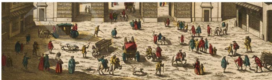
Ilustracja 10. Widok Paryża, brama Saint Martin, vue d'optique 31x45 cm, ok. 1760.

Kolejny efekt pozorowania przestrzenności grafiki przez zograscope związany jest z powszechną praktyką podkolorowywania vue d'optique , co nie jest zabiegiem czysto ornamentalnym. Powstaje dzięki temu efekt chromostereopsis – wrażenie głębi przestrzennej osiągnięte w dwuwymiarowych obrazach, na skutek zestawiania ze sobą kolorów odległych na skali „temperaturowej” barw 15 . Relatywne różnice temperatury barw przekładane są na wrażenie dystansu do oka obserwatora. Szczególnie aktywnie działają w tym kierunku skrajne zestawienia: czerwony – niebieski,