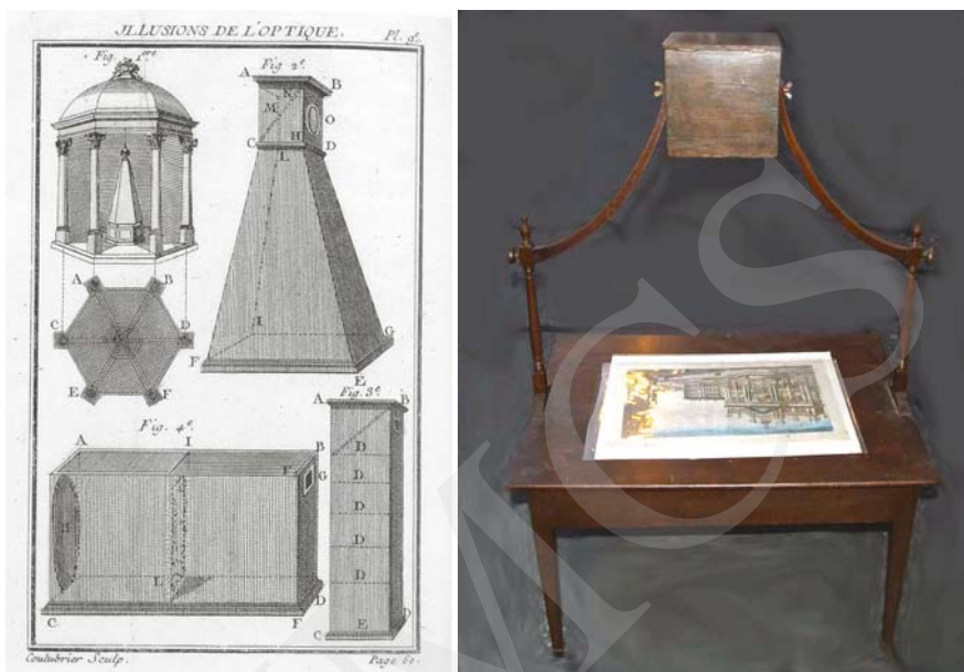
Ilustracja 4. Rémi-Claude Coulluber, Illusions de l'optique , grafika 1769, z dzieła Edme Gilles'a, Novuelles récerération physiques et matematicques... , wyd. Paryż 1969-70, vol. 3. Ilustracja 5. Zograscop w formie biurka.

Tak jak konstrukcja zograscopu wydaje się zadziwiająco prosta, to działanie optycznego agregatu vue d'optique-zograscopu jest zdumiewająco złożone. Z jednej strony zograscop wprowadza dywersję, zakłócając i minimalizując sygnały sensoryczne informujące o rzeczywistej płaszczyźnie kartonów vue d'optique 4 , z drugiej strony wysyła własne sygnały symulujące w umyśle widza wrażenia wirtualnej przestrzeni, do złudzenia przypominającej odczucia trójwymiarowej fizycznej przestrzeni, w której zlokalizowane są nasze ciała.