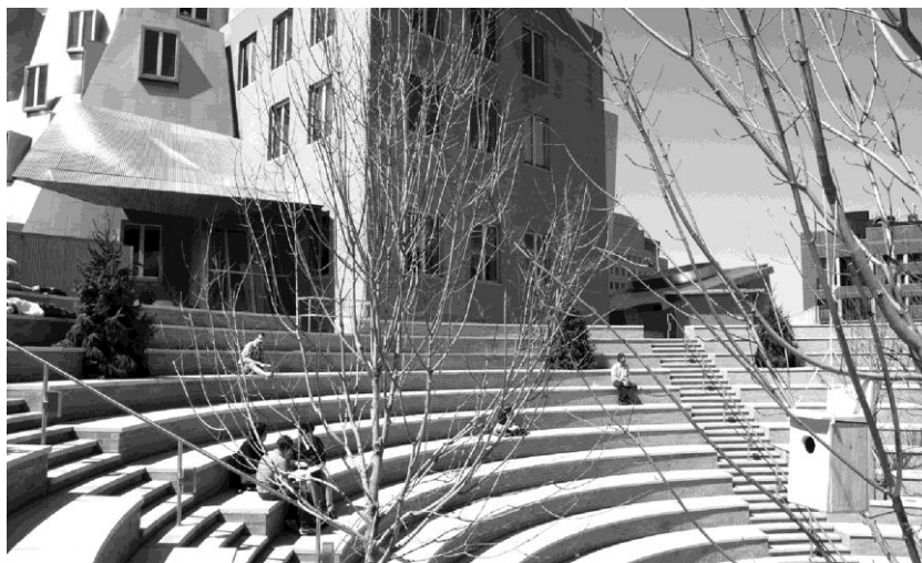
Rys. 4. Przestrzeń integracyjna na przykładzie projektu Fritza Haega w ramach cyklu Animal Estates (ANIMAL ESTATE regional model homes 3.0). Program dla miasta Cambridge, Massachusetts. Komisarz wystawy – Center for Advanced Visual Studies at MIT, kwiecień 2008.[7] autor: Frith Haeg.

zmiany sposobu użytkowania przestrzennego, w których powstają przestrzenie o mieszanym przeznaczeniu (są więc bardziej konfliktogenne z racji różnych praw własności) lub miejsca łączenia funkcji o charakterze liniowym i plamowym, jak parki z ciągami zieleni rekreacyjnej. Bardzo często zagospodarowuje się w ten sposób nieużytki miejskie, czyli miejsca posiadające prawnego właściciela, lecz celowo pozostawione w stanie niezagospodarowanym, a wykorzystywane biernie, np. pasy zieleni izolacyjnej, ochronnej itp.