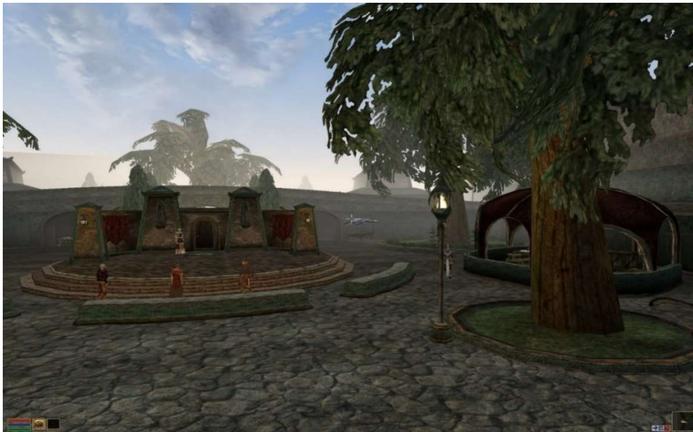
Mournhold, The Elder's Scrolls III: Morrowind

Przytoczone motywy mitologiczne są charakterystyczne dla pozytywnej, lunarnej symboliki miasta. Ma ona jednak także swój negatywny aspekt, związany z archetypem Strasznej Matki, kojarzonej ze śmiercią, pochłanianiem, ćwiartowaniem, niszczeniem, gniciem 10 . Ta ambiwalencja jest nieraz ujmowana jako przeciwstawienie dwóch stron miasta. Jak podaje Neumann: