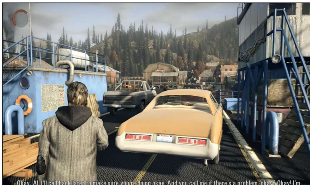
Bright Falls, Alan Wake

ścina za dnia, ale po zmroku zmienia się w teatr grozy i absurdu, z którego bohatera ratują tylko rozprasające mrok światło latarki i odwracający sen termos z kawą.