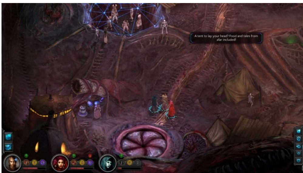
Wykwit, Torment: Tides of Numenera

miast w świecie przedstawionym gry. Położonym w Bezgraniczu (ang. The Beyond ) mieście rządzi tzw. Memovira – tytuł nadawany władcom Wykwitu. Dotychczas było ich jedynie dwóch, a drugim, aktualnie panującym, jest okrutna kobieta o niezwykłej urodzie, która sprawuje pieczę nad przejściami do innych wymiarów. Bezgranicze to rozległa dzicz, pełna osobliwych zjawisk, przedziwnych, odseparowanych od siebie ludów, a także tyranów. Mimo swej nieobliczalnej natury, Wykwit nieustannie przyciąga zarówno kupców i poszukiwaczy. Wabi ich wizją fortuny zdobytej ze sprzedaży porozrzucanych po wymiarach lub ukrytych w krętych tunelach numenerów 12 – bezcennego towaru w Dziewiątym Świecie (ang. The Ninth World ) – a także schronieniem w mięsistych fałdach-komorach. Szanse na przetrwanie w tym mieście-drapieżczy mają jednak nieliczni. Głęboko w czeluściach Wykwitu znajduje się Gardziel (ang. The Gullet ), organ miasta, który podtrzymuje siły vitalne miejskich struktur. Zagubione artefakty, antyczne maszyny czy też resztki „intruzów” upolowanych przez bytujących tam łowców są budulcem miasta, które „wypluwa” wszelkie pozostałości, niestrawione resztki „pokarmowe” przez swe portale. Pozostali mieszkańcy miasta, ci niestrawieni, „płacą” miastu za ochronę paranoidalnymi zaburzeniami osobowości.