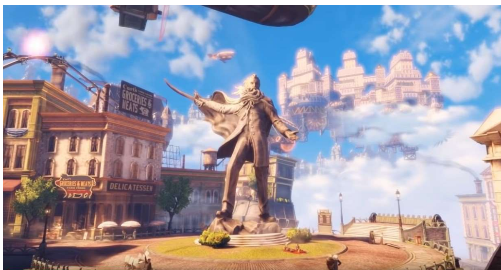
Columbia, Bioshock: Infinite

Za ilustrację posłużyć może gra Hotline Miami , zabierająca nas w neonowe realia lat 80, gdzie grana przez nas postać każdej nocy budzona jest telefonem przez jakichś żartownisiów nakazujących jej stawić się w to czy inne miejsce pod różnymi błahymi pretekstami. Nasz bohater niczym w transie wsiada do samochodu i wyrusza pod wskazany adres. Przed wejściem do środka wybiera ze swej kolekcji zwierzęcą maskę, która, po założeniu, łączy go z charakterystycznym dla danego zwierzęcia atawizmem. Po przekroczeniu progu staje się bezlitosnym, brutalnym mordercą, który dokonuje rzezi całego lokalu w akompaniamencie psychodelicznego rocka i muzyki transowej. Nie wiemy, czym kierowana postać zajmuje się w ciągu dnia; przejmujemy nad nią kontrolę dopiero w nocy, a każda noc odmalowuje ten sam schemat w coraz bardziej surrealistyczny sposób. Tam, gdzie na początku zarysowywał się sens i potencjalne wytłumaczenie akcji, stopniowo wkrada się nihilistyczny absurd.