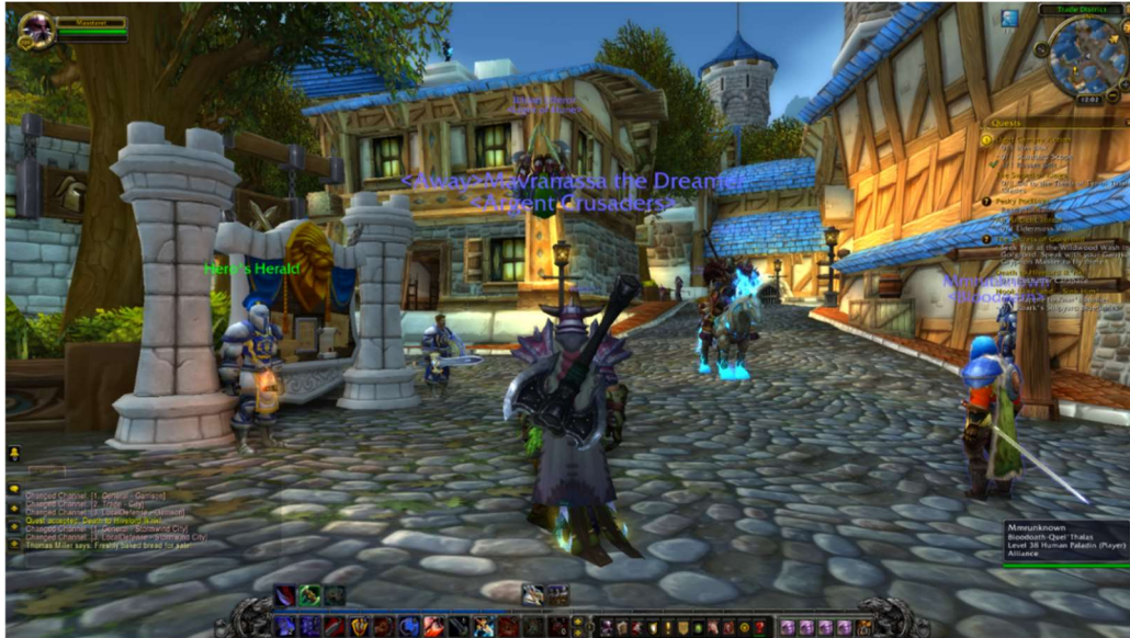
Stormwind, World of Warcraft

„zamieszkuje miasto”, jego konkretyzacją jest mieszkaniec, który porusza się w strukturze miejskiej, wystawiony na rozmaitego rodzaju oddziaływania.