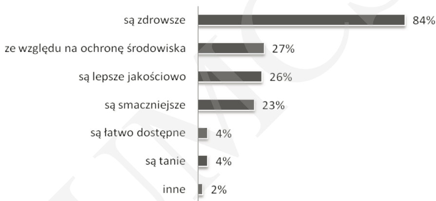
Rysunek 3. Motywy kupowania produktów ekologicznych