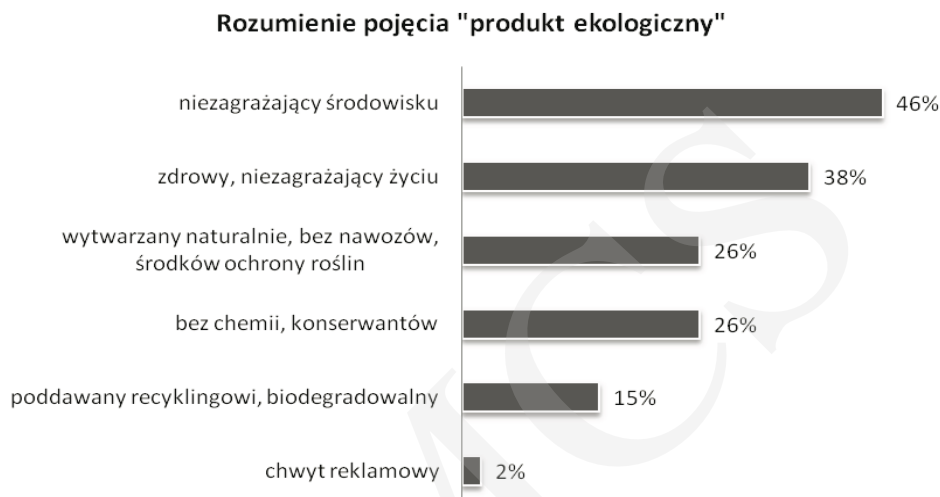
Rysunek 1. Rozumienie pojęcia „produkt ekologiczny” w opinii badanych konsumentów