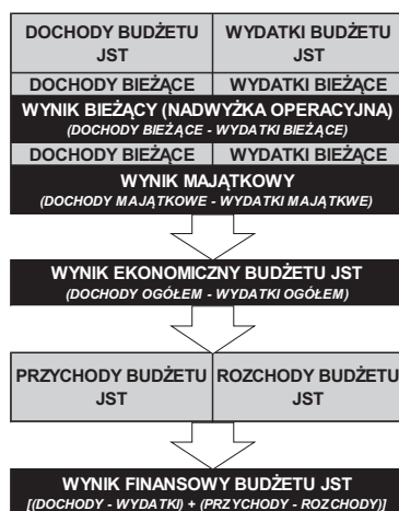
Rys. 1. Elementy równoważenia budżetu JST