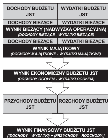
Rys. 1. Elementy równoważenia budżetu JST