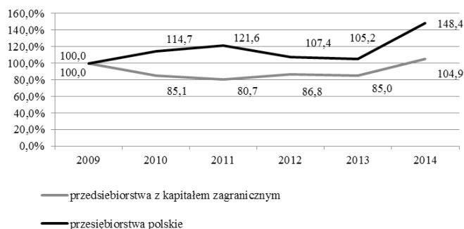
Rys. 1. Dynamika nakładów inwestycyjnych na zakup środków trwałych w przedsiębiorstwach regionu łódzkiego według struktury własnościowej w latach 2009–2014 (rok 2009 = 100)

Kolejną zmienną charakteryzującą poszczególne grupy podmiotów, funkcjonujące na terenie województwa łódzkiego, jest aktywność inwestycyjna mierzona dynamiką nakładów na zakup środków trwałych.