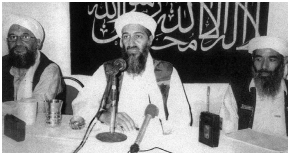
Rys. 1. Goście audycji propagującej przez internet terroryzm

tylko o potomków muzułmańskich imigrantów ulegających radykalizacji religijnej i ideologicznej, ale również o młodych ludzi zafascynowanych nową religią i nową ideologią. Minister bezpieczeństwa USA, Michael Chertoff, składając wyjaśnienia przed senacką Komisją Bezpieczeństwa Wewnętrznego i Spraw Rządowych, powiedział, że internet jest obecnie głównym medium, przez które Al-Kaida zdobywa zwolenników w USA.