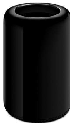
Mac Pro (2014 r.)

Rysunek 4. Jeden z pierwszych komputerów firmy Apple oraz produkt współczesny