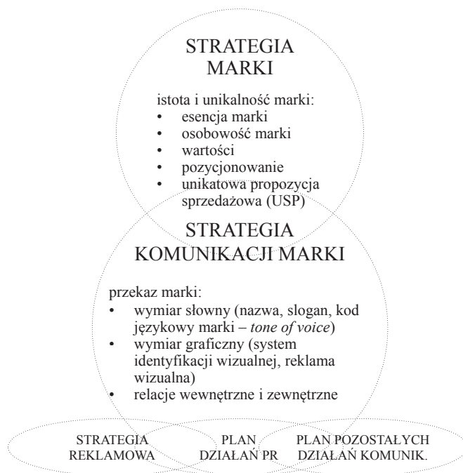
Rysunek 3. Strategia marki a strategia komunikacji marki

Komunikacja na poziomie werbalnym to specyficzny język marki, jej wymiar słowny. Najbardziej oczywistym elementem tego języka jest nazwa marki, która powinna odbiorcom czytelnie prezentować esencję marki. Oprócz wyboru nazwy marki i sloganu należy ustalić tzw. kod językowy marki ( tone of voice ), który jest zbiorem reguł rządzących stylem komunikacji werbalnej. Chodzi na przykład o dobór słownictwa używanego w komunikacji marki, sposób pisania tekstów reklamowych, itp.