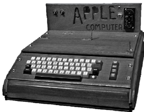
Apple-1 (1976 r.)

W nowoczesnym podejściu do systemu identyfikacji wizualnej pojęcie to rozciąga się na inne, do tej pory pomijane obszary. Na przykład coraz większy nacisk kładzie się na estetykę produktów oraz ich opakowań (por. rysunek 4). Jak twierdzi Moira Cullen, „design odgrywa fundamentalną rolę w kreowaniu marek; projekt wyodrębnia i uosabia rzeczy nieuchwytnie – emocje, kontekst, istotę, które mają największe znaczenie dla konsumentów” [Wheeler, 2010, s. 4].