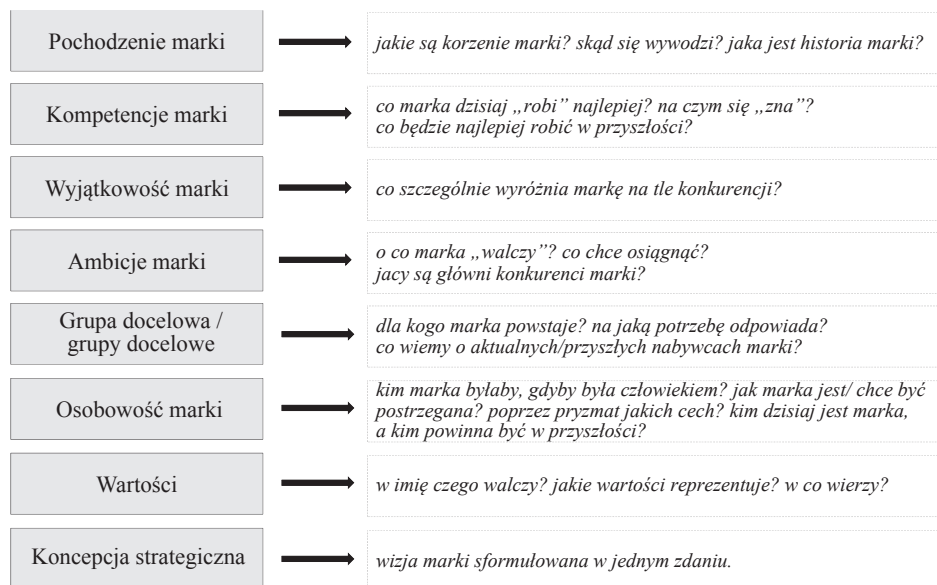
Rysunek 1. Brand Foundations – strategia marki wg firmy Corporate Profiles Consulting