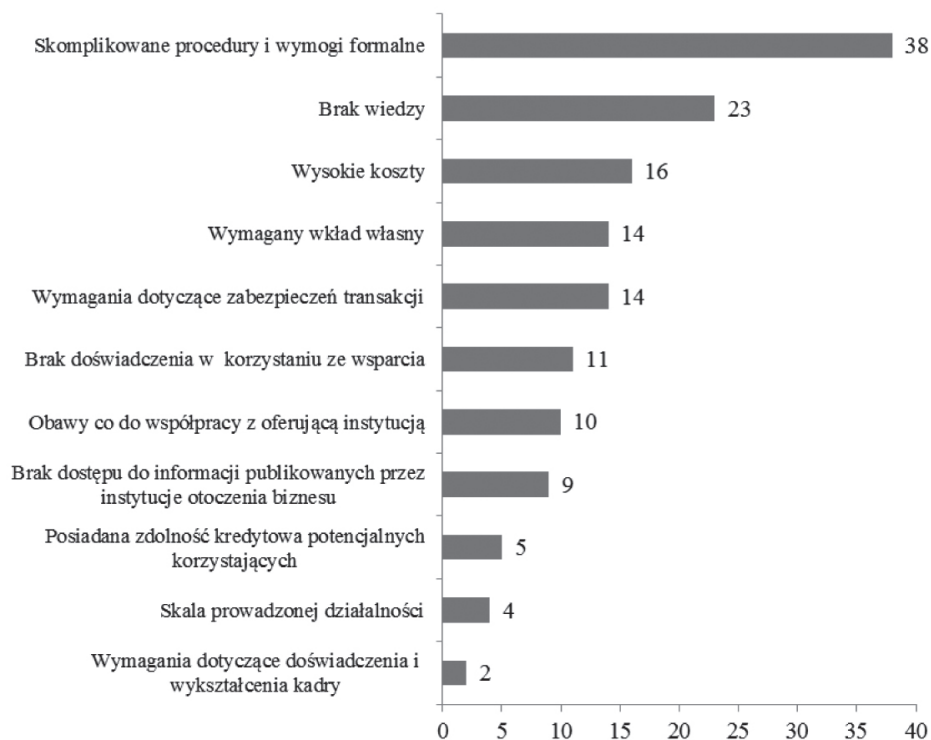
Rysunek 2. Bariery współpracy przedsiębiorstw z instytucjami otoczenia biznesu

Pomimo szerokiej oferty instytucji otoczenia biznesu respondenci dostrzegają pewne bariery w podjęciu współpracy (rysunek 2). Najważniejszym czynnikiem uniemożliwiającym uzyskanie wsparcia są skomplikowane procedury i wymogi formalne (38 wskazań). Ponadto firmy zwracały również uwagę na niewystarczającą wiedzę (23 podmioty). Tego typu ograniczenia są uciążliwe zarówno dla małych przedsiębiorstw, jak i dużych spółek dysponujących znacznymi środkami finansowymi i dostępem do porad prawnych. Jednakże dla nowo powstałych przedsiębiorstw koszty i zniechęcający charakter biurokratycznych utrudnień mogą okazać się niemożliwe do pokonania. W wielu przypadkach przedsiębiorstwa, które mają problem z uzyskaniem wsparcia od instytucji otoczenia biznesu, porzucają plany wejścia na rynek. Zniesienie tych barier może wpłynąć na wykorzystanie licznych możliwości biznesowych, związanych między innymi z wejściem na nowe rynki.