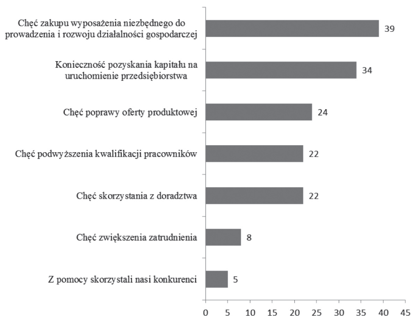
Rysunek 1. Przyczyny współpracy przedsiębiorstw z instytucjami otoczenia biznesu