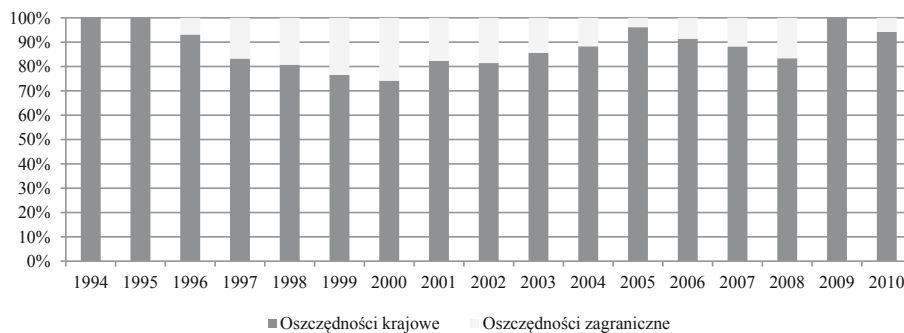
Rysunek 1. Udział procentowy w finansowaniu inwestycji krajowych oszczędności krajowych oraz oszczędności zagranicznych w Polsce w latach 1994–2010

Inwestycje krajowe w Polsce w latach 1994–2010 były w przytłaczającej wielkości finansowane oszczędnościami krajowymi. Stopień pokrycia średniorocznych inwestycji krajowych oszczędnościami krajowymi wynosił w tym okresie średniorocznie około 89%. Zmiany udziału procentowego finansowania inwestycji przez oszczędności krajowe oraz zagraniczne (różnica między inwestycjami krajowymi a oszczędnościami krajowymi) w Polsce w okresie od 1994 do 2010 roku przedstawiono na rysunku 1. Z kolei na rysunku 2 pokazano kształtowanie się inwestycji i oszczędności krajowych w relacji do PKB.