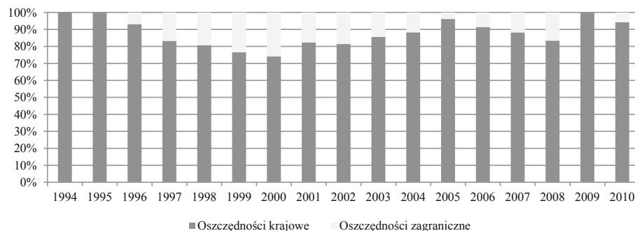
Rysunek 1. Udział procentowy w finansowaniu inwestycji krajowych oszczędności krajowych oraz oszczędności zagranicznych w Polsce w latach 1994–2010

Inwestycje krajowe w Polsce w latach 1994–2010 były w przytłaczającej wielkości finansowane oszczędnościami krajowymi. Stopień pokrycia średniorocznych inwestycji krajowych oszczędnościami krajowymi wynosił w tym okresie średniorocznie około 89%. Zmiany udziału procentowego finansowania inwestycji przez oszczędności krajowe oraz zagraniczne (różnica między inwestycjami krajowymi a oszczędnościami krajowymi) w Polsce w okresie od 1994 do 2010 roku przedstawiono na rysunku 1. Z kolei na rysunku 2 pokazano kształtowanie się inwestycji i oszczędności krajowych w relacji do PKB.