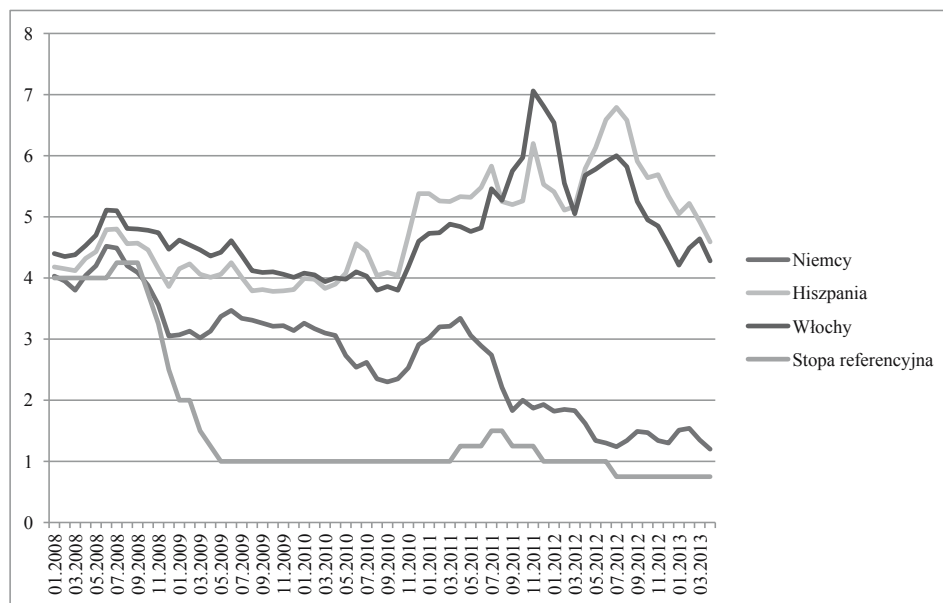
Rysunek 2. Stopy referencyjne EBC i rentowność rządowych papierów dłużnych wybranych państw strefy euro w okresie styczeń 2008–marzec 2013 roku (w %)

gospodarczej w strefie euro, stopy procentowe EBC zwiększono o 25 punktów bazowych. Do następnej takiej podwyżki doszło 13 listopada 2011 roku. 9 listopada 2011 roku rozpoczął się natomiast kolejny okres obniżek stóp procentowych. W wyniku czterech decyzji stopa referencyjna została zredukowana o 100 punktów bazowych, zaś stopa depozytowa osiągnęła poziom 0%. W ten sposób stopy procentowe w strefie euro osiągnęły historyczne minimum.