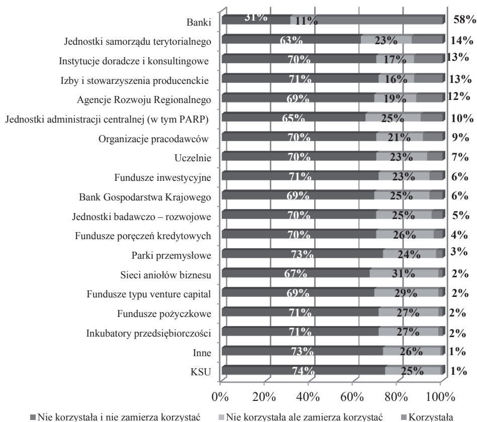
Rysunek 1. Rzeczywiste wsparcie przedsiębiorstw realizujących projekty innowacyjne uzyskane w poszczególnych instytucjach otoczenia biznesu