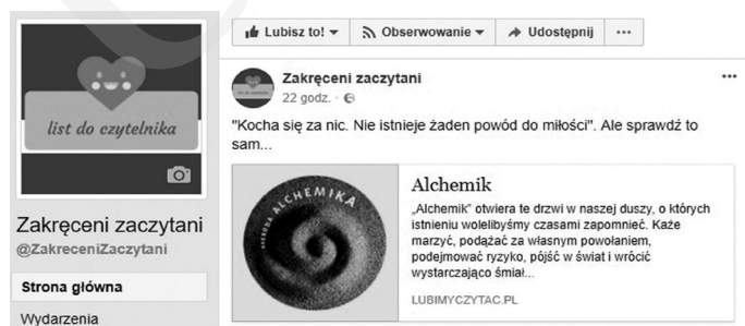
Rycina 2. Post „Kocha się za nic. Nie istnieje żaden powód do miłości. Ale sprawdź to sam...” zamieszczony na fan page'u „Zakręcenii zacytani” 47 .