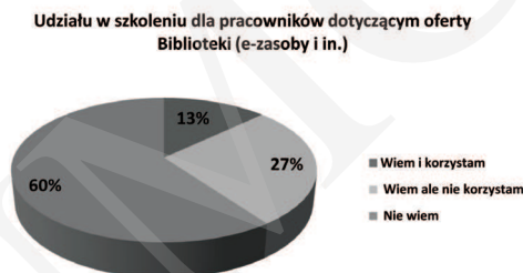
Ryc. 3. Znajomość oferty szkoleniowej dla pracowników.

Oferta Biblioteki Głównej UP w zakresie prowadzenia szkoleń dla pracowników uczelni jest znana mniej niż połowie ankietowanych (40%). Jednak z całej grupy badanych aż 158 zaznaczyło, że nie korzysta z tej oferty szkoleń (ryc. 3). Zachowanie to można tłumaczyć nieznaną ofertą biblioteki bądź własnymi umiejętnościami informacyjnymi użytkowników bibliotek uniwersyteckich. Użytkownicy sprawnie posługujący się informacjami w sieci mogą nie być zainteresowani tą usługą biblioteki. Jednak jak wynika z doświadczenia pracy z użytkownikiem poszukującym informacji naukowej, brak zainteresowania zdobywaniem szerszych umiejętności korzystania z zasobów biblioteki wpływa na wykorzystanie zaledwie ich części.