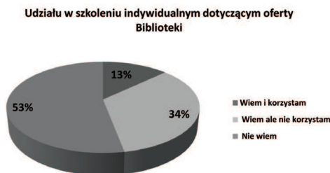
Ryc. 2. Znajomość oferty szkoleniowej dla indywidualnych czytelników.

Analizując kolejne pytanie, zauważono, że duży odsetek (53%) ankietowanych nie zdaje sobie sprawy z możliwości uczestniczenia w szkoleniu indywidualnym dotyczącym oferty biblioteki. Taki wynik wskazuje na potrzebę ciągłego informowania oraz wprowadzenia nowych sposobów na docieranie do użytkowników. Zastanawiające jest także to, że jedynie 13% badanych korzystało z indywidualnego przeszkolenia, co sugeruje konieczność większego otwarcia się bibliotekarzy na przychodzącego czytelnika (ryc. 2).