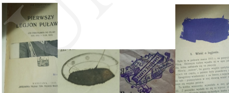
Ryc. 4. Przykłady dezaktualizacji pieczętek.

Odcisk tuszowy pieczętki można łatwo usunąć za pomocą odpowiednich odczynników chemicznych, w przeciwieństwie do odbitej farbą drukarską czy wykonanej przy użyciu suchego tłoku. Spotyka się też przypadki dewastacji pieczętek przez usunięcie fragmentu strony, na której się znajdowała, jej wycięcia czy zamazania ciemnym tuszem lub innym środkiem uniemożliwiającym odczytanie, a także nałożenie – odbicie nowej pieczętki na już istniejącą (ryc. 4).