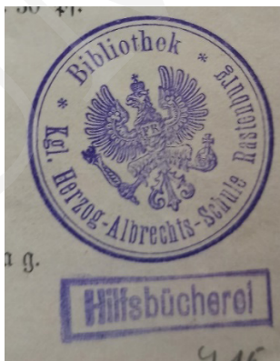
Ryc. 11. Pieczętka Biblioteki Gimnazjum w Rastenburgu.

Izba Przemysłowo-Handlowa w Lublinie powstała w marcu 1929 r. 38 W pracach nad jej założeniem brali udział polscy i żydowscy właściciele największych przedsiębiorstw handlowych, przedstawiciele kupiectwa lubelskiego i wołyńskiego, osoby reprezentujące banki i największe zakłady przemysłowe, a także znani działacze społeczni, radni miasta i politycy. Z jej inicjatywy została utworzona w 1931 r. Giełda Zbożowo-Towarowa w Lublinie 39 oraz jej filia w Równem na Wołyniu. Izba Przemysłowo-Handlowa w Lublinie posiadała bibliotekę 40 . Na mocy zarządzenia przewodniczącego Państwowej Komisji Planowania Gospodarczego w 1950 r. zakończyła działalność. Likwidacja jej spowodowała, że obszerny księgozbiór, liczący 5,5 tys. tomów, wraz z czasopismami, został przekazany do Zakładu Ekonomii Politycznej Katedry Ekonomii Wydziału Prawa i międzywydziałowego Instytutu Nauk Ekonomicznych UMCS. „Dzięki temu UMCS zawdzięcza Izbie posiadanie nieocenionych sprawozdań wojewody wołyńskiego. [...] Praktycznie każdy tom opatrzony był interesującym exlibrisem, przedstawiającym patrona kupców – Merkurego (w uskrzydłonym kapeluszu) oraz kołem zębatym – symbolem przemysłu” 41 .