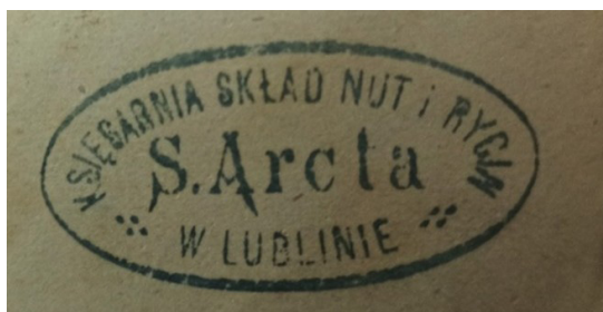
Ryc. 6. Pieczęćka firmy wydawniczo-księgarskiej Stanisława Arcta.

Waław Bajkowski był wybitnym polskim prawnikiem i społecznikiem, który pełnił funkcję prezydenta Lublina w latach 1916–1918 20 . Urodził się 31 grudnia 1875 r. we wsi Włostowice koło Puław. Po studiach prawniczych na Uniwersytecie Warszawskim w 1903 r. rozpoczął aplikację adwokacką w Lublinie, specjalizując się w prawie cywilnym. Oprócz pracy zawodowej angażował się również w działalność publiczną i samorządową, był jednym z organizatorów sądownictwa obywatelskiego w Lublinie. Na jego wniosek Rada Miejska z okazji 600-lecia nadania Lublinowi praw miejskich uchwaliła, by placowi przed Magistratem nadać imię króla Władysława Łokietka oraz zażądać zwrotu wywiezionych do Wilna najstarszych zasobów archiwalnych ziemi lubelskiej i Podlasia. W 1940 r. został zatrzymany przez Gestapo, wywieziony do obozów koncentracyjnych Sachsenhausen i Dachau, gdzie 11 kwietnia 1941 r. zginął. W uznaniu zasług Waława Bajkowskiego w 2009 r. ulica przy gmachu Ratusza (wcześniej ul. Przystankowa) została nazwana jego imieniem.