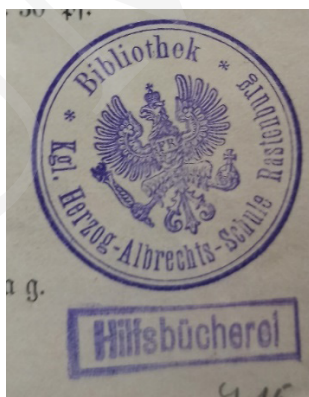
Ryc. 11. Pieczęć Biblioteki Gimnazjum w Rastenburgu.

Izba Przemysłowo-Handlowa w Lublinie powstała w marcu 1929 r. 38 W pracach nad jej założeniem brali udział polscy i żydowscy właściciele największych przedsiębiorstw handlowych, przedstawiciele kupiectwa lubelskiego i wołyńskiego, osoby reprezentujące banki i największe zakłady przemysłowe, a także znani działacze społeczni, radni miasta i politycy. Z jej inicjatywy została utworzona w 1931 r. Giełda Zbożowo-Towarowa w Lublinie 39 oraz jej filia w Równem na Wołyniu. Izba Przemysłowo-Handlowa w Lublinie posiadała bibliotekę 40 . Na mocy zarządzenia przewodniczącego Państwowej Komisji Planowania Gospodarczego w 1950 r. zakończyła działalność. Likwidacja jej spowodowała, że obszerny księgozbiór, liczący 5,5 tys. tomów, wraz z czasopismami, został przekazany do Zakładu Ekonomii Politycznej Katedry Ekonomii Wydziału Prawa i międzywydziałowego Instytutu Nauk Ekonomicznych UMCS. „Dzięki temu UMCS zawdzięcza Izbie posiadanie nieocenionych sprawozdań wojewody wołyńskiego. [...] Praktycznie każdy tom opatrzony był interesującym exlibrisem, przedstawiającym patrona kupców – Merkurego (w uskrzydłym kapeluszu) oraz kołem zębatym – symbolem przemysłu” 41 .