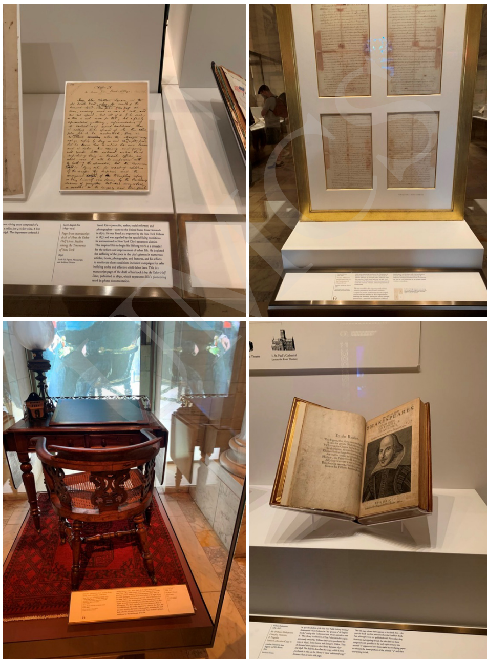
Fot. 6. Zbiory Nowojorskiej Biblioteki, fot. A. Strumińska.

W zbiorach Nowojorskiej Biblioteki Publicznej znajduje się wiele cennych dzieł, takich jak: Biblia Guttenberga czy rękopis Deklaracji Niepodległości napisany przez