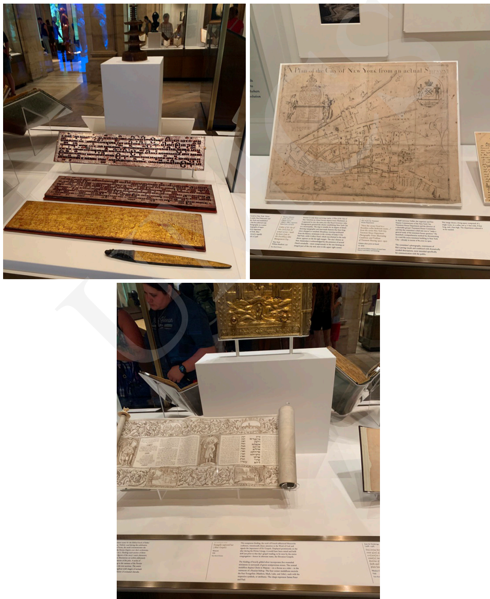
Fot. 7.

Thomasa Jeffersona, oryginalny list Admirala Floty – Krzysztofa Kolumba do króla Hiszpanii z 15 lutego 1493 roku o tym, że odkrył Amerykę 3 .