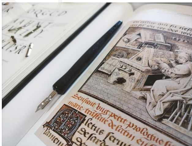
Fot. 1. Przykłady iluminacji i tradycyjnych materiałów piśmienniczych, fot. A. Mikulska.

W dniach 18–24 września 2023 roku Uniwersytet Marii Curie-Skłodowskiej w Lublinie aktywnie włączył się w organizację Lubelskiego Festiwalu Nauki. Dziewiętnasta edycja wydarzenia osiągnęła rekordowe wyniki pod względem zgłoszonych projektów – aż 1758 wydarzeń, prezentacji i warsztatów. Zgromadziła