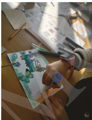
Fot. 10. Twórcze poszukiwania w pracy nad inicjałem, fot. A. Mikulska.

ficznych. Była również czasem efektywnej współpracy budującej wiedzę i umiejętności uczestników oraz wzbogacającej doświadczenie dydaktyczne bibliotekarzy. Historyczne zbiory z bibliotecznych półek zabrały uczestników w podróż w czasie od zarania dziejów przez tajemnicze wnętrza średniowiecznych skryptoriów, ukazując ponadczasowość sztuki, idącej w parze z nauką w korowodzie ku przyszłości.