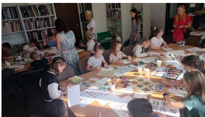
Fot. 8. Uczniowie podczas pracy warsztatowej – projektowanie iluminowanego inicjału