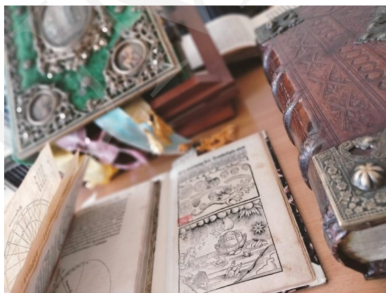
Fot. 2. Prezentacja starodruków gromadzonych w Oddziale Zbiorów Specjalnych, fot. A. Mikulska.

imponującą liczbę uczestników, pragnących poszerzać horyzonty w świecie nauki i sztuki. Temat przewodni tegorocznej edycji „Nauka dla przyszłości” eksponował wartość badań naukowych i innowacyjnych rozwiązań technologicznych wynoszących ludzkość ku nieznanym i niedostępnym wcześniej obszarom. Hasło wiodące festiwalu zainspirowało również społeczność Biblioteki Uniwersytetu Marii Curie-Skłodowskiej w Lublinie do twórczego wglądu w bogate zasoby księgozbioru, stanowiącego zarówno cenną bazę dydaktyczną, jak i świadectwo rozwoju człowieka w wielu dziedzinach naukowych oraz artystycznych. Wydarzenia o charakterze wystawienniczym oraz warsztatowym zorganizowane na terenie Biblioteki kierowały uwagę odbiorców ku atrakcyjnie wydany pozycjom wydawniczym, wprowadzającym młodych czytelników w świat nauki. Mimo iż hasło przewodnie prowadziło myśl ku przyszłości, nie pominięto zasobów o wartości historycznej, dokumentów rękopiśmiennych o znamionach pierwszych naukowych publikacji i pierwszych przykładów druku, obrazujących rozwój nauki na przestrzeni wieków.