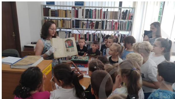
Fot. 7. Warsztaty „Iluminowany inicjał” – wprowadzenie teoretyczne