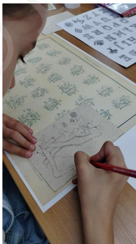
Fot. 9. Precyzyjne szkicowanie projektu, fot. A. Mikulska.

Warsztaty cieszyły się dużym zainteresowaniem, a uczniowie we wszystkich grupach wiekowych wykazali się zaangażowaniem podczas realizacji zadań, korzystając z wiedzy uzyskanej podczas części wprowadzającej. Młodszy uczestnicy pomimo wyższego stopnia trudności związanego z początkami nauki pisania wyróżniali się dużą kreatywnością. Praca dzieci przebiegała dwutorowo – część uczniów skoncentrowała się na pierwszym etapie projektowania inicjału i tworzeniu szkicu, starając się zagospodarować całą powierzchnię kartki i wielokrotnie nanosząc poprawki. Wśród pozostałych „iluminatorów” w akcie twórczym dominowała spontaniczność i odważna ekspresja przy zastosowaniu łączonych materiałów, jak farby, brokat, elementy dekoracyjne. We wszystkich grupach wiekowych ważnym czynnikiem okazało się wskazywanie etapów pracy oraz określanie ram czasowych dla poszczególnych części zadania. Pomocą metodyczną dla prowadzących stanowił plan pracy w formie opracowanego autorskiego scenariusza zajęć, jako punkt odniesienia pomocny przy moderowaniu działań uczniów. Przewidywany czas zajęć wynosił 60 minut, co wymuszało intensywne tempo pracy, wydawało się jednak optymalne z uwagi na możliwości utrzymania uwagi całej grupy.