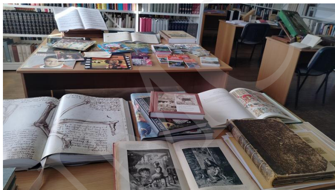
Fot. 3. Prezentacja zróżnicowanych materiałów gromadzonych w Oddziale Zbiorów Specjalnych, fot. A. Mikulska.

bibliotecznych oraz prowadzenia zajęć warsztatowych, przyjmują rolę przewodnika w świecie sztuki. Wybór grupy wiekowej, odbiegającej od standardów statystycznych dla bibliotek naukowych, nie jest przypadkowy. Działaniom tym przyświeca idea wzbudzenia w odbiorcach w wieku szkolnym pozytywnych skojarzeń związanych z miejscem, jakim jest Biblioteka, już na początku ich edukacyjnej drogi. Tworzymy dostępną i przyjazną przestrzeń, zapraszamy do ciekawego świata nauki.