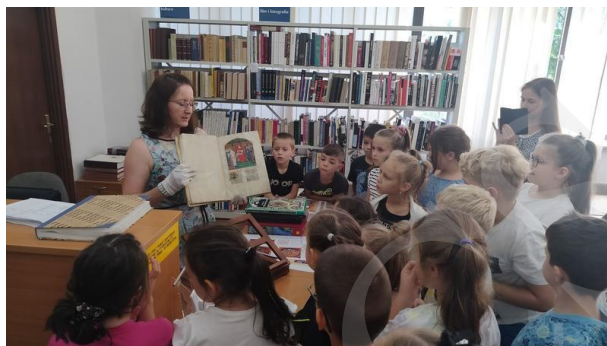
Fot. 7. Warsztaty „Iluminowany inicjał” – wprowadzenie teoretyczne