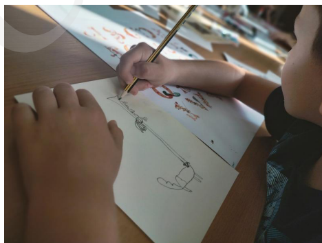
Fot. 6 . Projektowanie inicjału, fot. A. Mikulska.

Bogactwo fantazyjnych inicjałów oraz wibrujących kolorem wielobarwnych bordiur zainspirowało do działań twórczych uczestników warsztatów kreatywnych, przygotowanych w Oddziale Zbiorów Specjalnych dla zorganizowanych grup szkolnych.