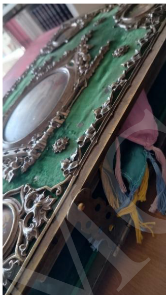
Fot. 4. Biblia w kunsztownie wykonanej oprawie, fot. A. Mikulska.

Duże wrażenie wywarła prezentacja najstarszych zasobów bibliotecznych, sięgających początków rozwoju druku, jak Biblia w przekładzie Marcina Lutera z 1686 roku o objętości około 4 tysięcy stron i wadze kilku kilogramów. Imponujące księgi oprawne w okładki wykonane z desek pokrytych tłoczoną skórą czy aksamitnym sukniem i opatrzonej dekoracyjnymi okuciami zaintrygowały odwiedzających, zapraszając do refleksji nad wartością oraz rozwojem książki w aspekcie historycznym i kulturalnym.