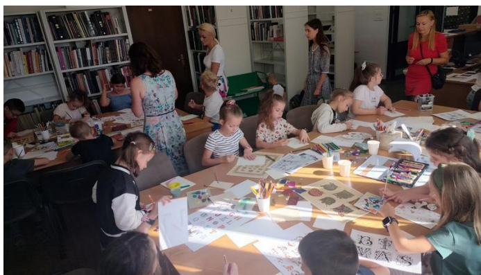
Fot. 8. Uczniowie podczas pracy warsztatowej – projektowanie iluminowanego inicjału