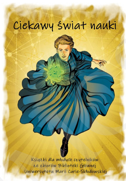
Fot. 1. Plakat reklamujący wystawę, autorstwa I. Mielniczuk i M. Zawady, zamieszczony na witrynie internetowej BG UMCS oraz ustawiony na wejściu przed wystawą.

Książki zaprezentowano na stołach i mobilnych ekspozytorach w kilku blokach tematycznych, np. astronomia, medycyna, historia itp. Przy każdym przygotowano tablice z ciekawymi informacjami oraz postaciami ze świata nauki. Uzupełnieniem prezentowanych pozycji książkowych był stary sprzęt techniczny w postaci dwóch telefonów tarczowych oraz maszyn do pisania. Dla odwiedzających przygotowano strefę relaksu, w której można było odpocząć i poczytać. Obok znajdował się kącik plastyczny, w którym najmłodszy odwiedzający mieli możliwość uwiecznienia wrażeń z wystawy. Pozostawione przez nich dzieła były prezentowane na specjalnej tablicy umieszczonej obok wystawy.