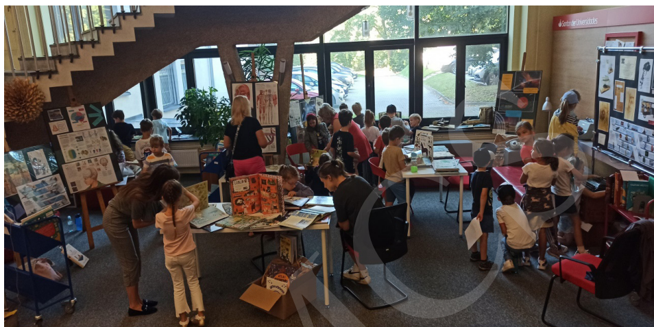
Fot. 2. Wystawa, fot. I. Mielniczuk.

Podczas 5 dni XIX Lubelskiego Festiwalu Nauki wystawę odwiedziło 20 zorganizowanych grup uczniów reprezentowanych przez klasy 0–8 szkół podstawowych z Lublina i okolic, przedszkolaki oraz osoby prywatne zainteresowane literaturą dziecięcą. W sumie wystawę odwiedziło 431 osób.