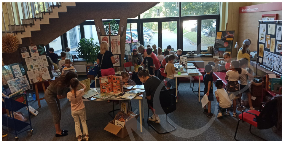
Fot. 2. Wystawa, fot. I. Mielniczuk.

Podczas 5 dni XIX Lubelskiego Festiwalu Nauki wystawę odwiedziło 20 zorganizowanych grup uczniów reprezentowanych przez klasy 0–8 szkół podstawowych z Lublina i okolic, przedszkolaki oraz osoby prywatne zainteresowane literaturą dziecięcą. W sumie wystawę odwiedziło 431 osób.