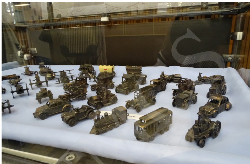
Fot. 4. Wystawa „Małeńkie cudenka – niezwykła pasja kolekcjonera temperówek” w holu Biblioteki Głównej UMCS w Lublinie.