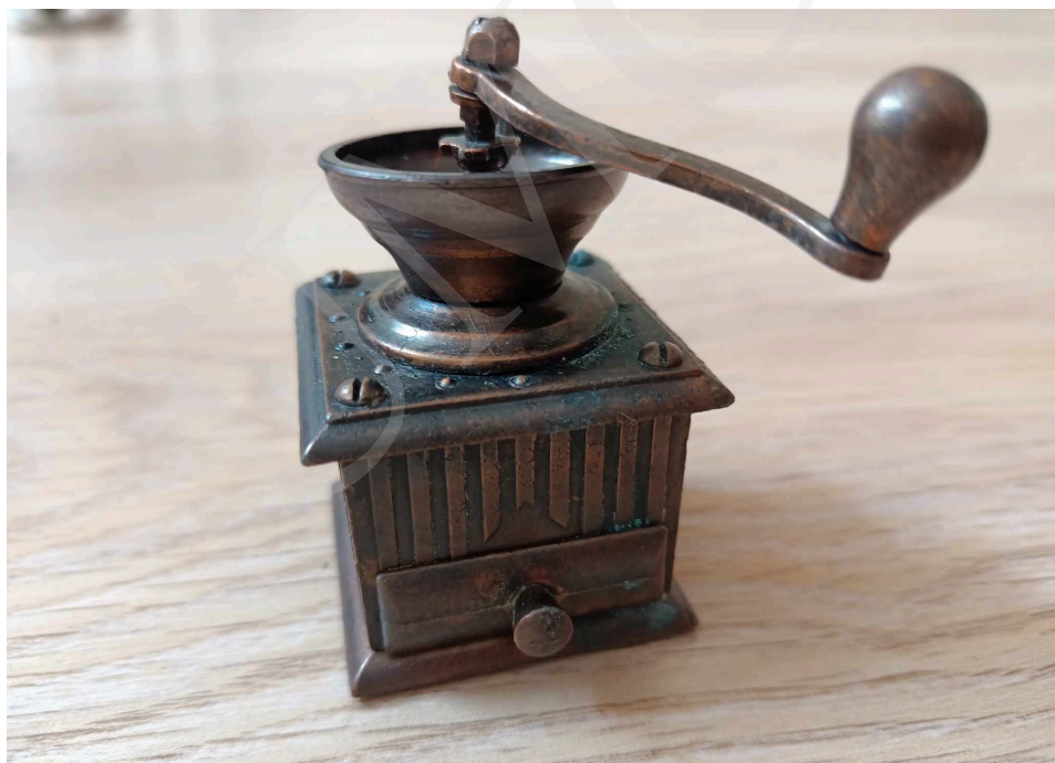
Fot. 1. Wystawa „Malańkie cudenka – niezwykła pasja kolekcjonera temperówek” w holu Biblioteki Głównej UMCS w Lublinie.

Właścicielką przedstawionych eksponatów oraz prezentowanych zdjęć jest pani Alicja Juszcak, nauczycielka na co dzień pracująca w Prywatnej Szkole Podstawowej im. Królowej Jadwigi w Lublinie. Od 18 lat kolekcjonuje temperówki, które mają kształty różnych przedmiotów codziennego użytku: miniatur militariów, instrumentów muzycznych, pojazdów czy budynków. Co ciekawe, każdy z tych przedmiotów posiada ruchome elementy: otwierane szuflady i drzwiczki czy pokrętła i korbki. Przepiękne unikatowe temperówki o doskonale odwzorowanych detalach wykonano z niezwykłą precyzją szczegółów. Obecnie kolekcja liczy 187 sztuk i nadal jest powiększana. Głównie są to pamiątki przywożone z podróży po różnych krajach.