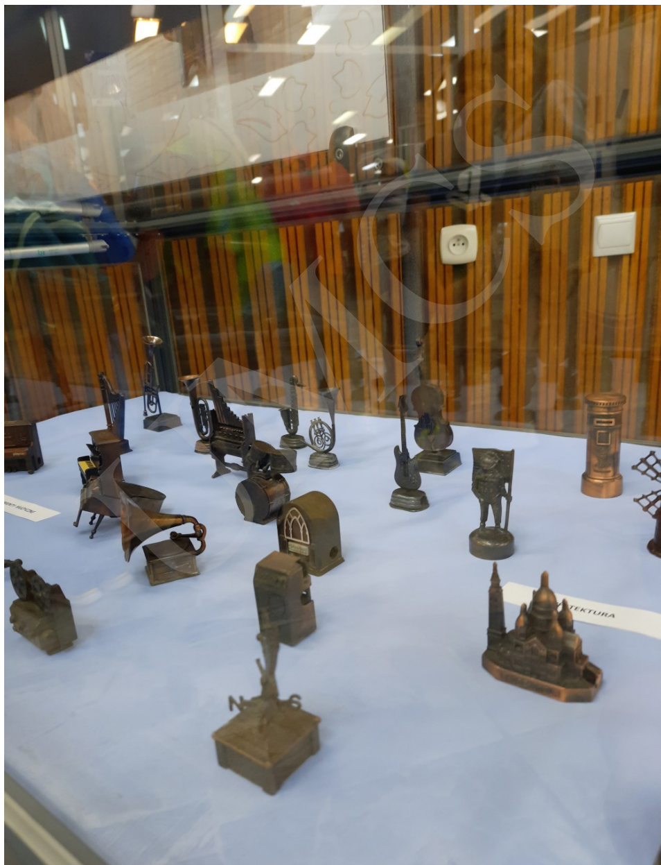
Fot. 6. Wystawa „Malańkie cudzeńka – niezwykła pasja kolekcjonera temperówek” w holu Biblioteki Głównej UMCS w Lublinie.