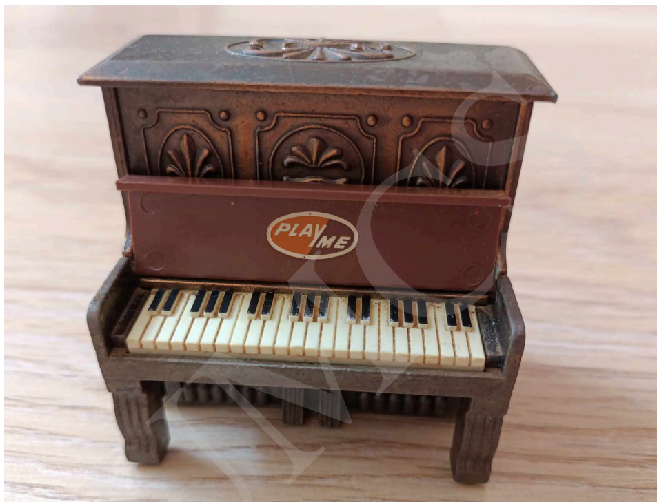
Fot. 3. Wystawa „Malańkie cudenka – niezwykła pasja kolekcjonera temperówek” w holu Biblioteki Głównej UMCS w Lublinie.