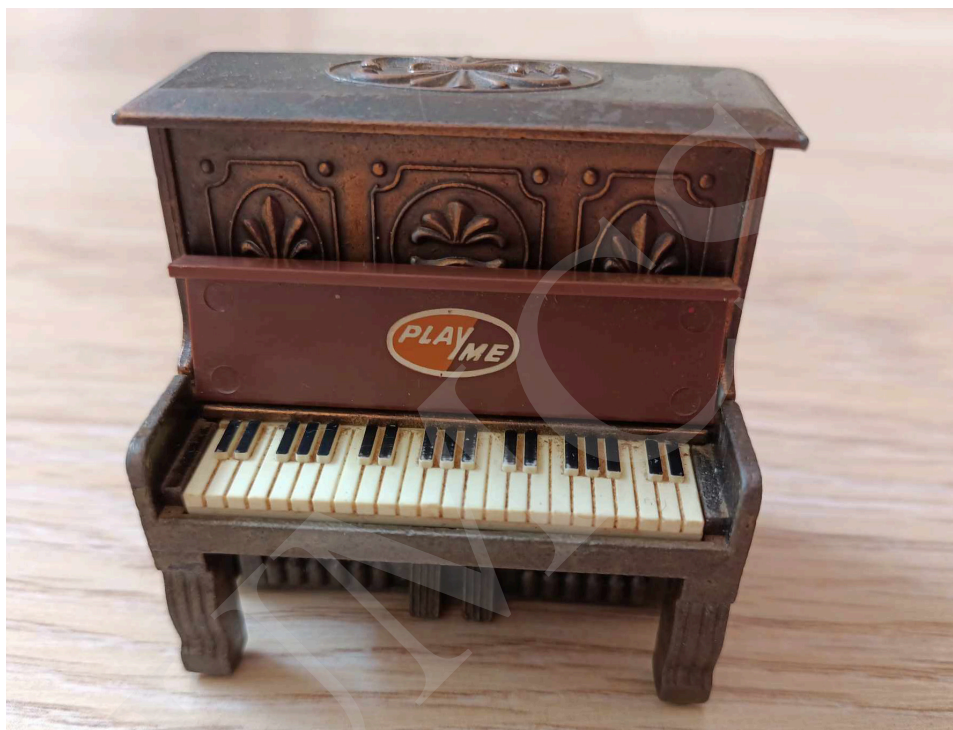
Fot. 3. Wystawa „Malańkie cudenka – niezwykła pasja kolekcjonera temperówek” w holu Biblioteki Głównej UMCS w Lublinie.