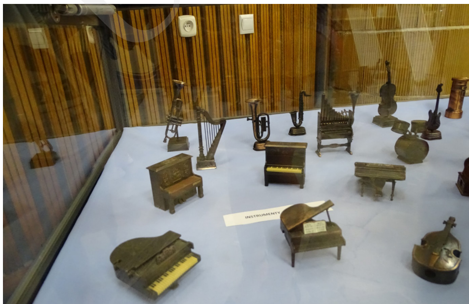
Fot. 5. Wystawa „Małeńkie cudenka – niezwykła pasja kolekcjonera temperówek” w holu Biblioteki Głównej UMCS w Lublinie.