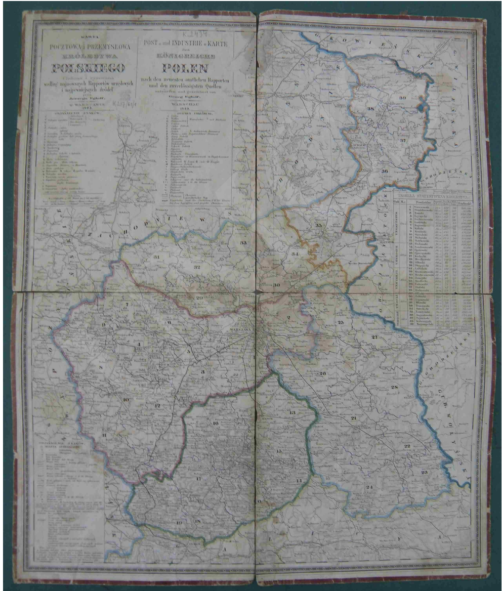
Fot. 11. Karta pocztowa i przemysłowa Królestwa Polskiego. Ułożona i rysowana według najnowszych raportów urzędowych i najpewniejszych źródeł przez Jerzego Engloffa