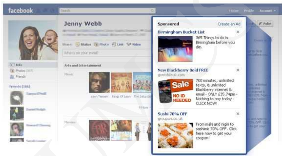
Ryc. 4. Facebook – reklama

lubi bądź obserwuje. Użytkownik ma przeświadczenie, że pokazuje znajomym, co lubi, a tak naprawdę dopuszcza do siebie kolejnych reklamodawców. Co gorsza, przeglądając strumień danych na Facebooku, użytkownik nie zauważa, że wśród informacji z profili znajomych znajdują się także ukryte reklamy 10 .