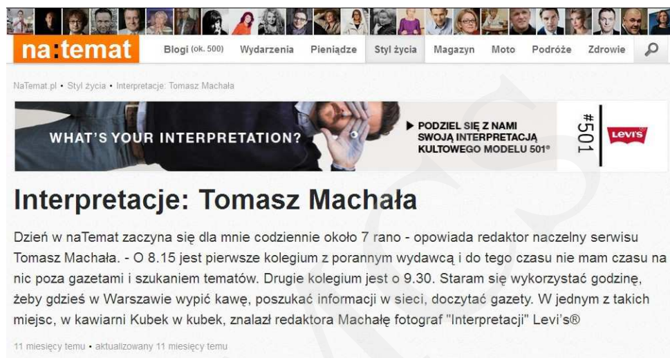
Ryc. 1. Interpretacje: Tomasz Machała