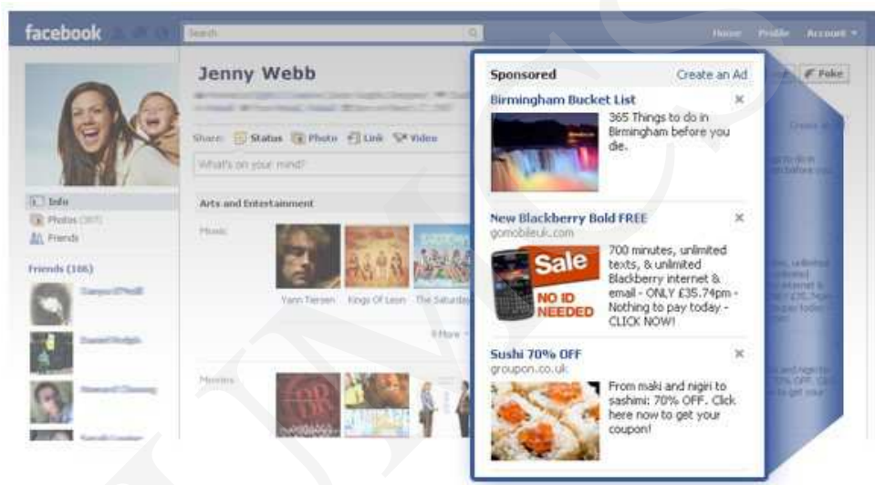
Ryc. 4. Facebook – reklama

lubi bądź obserwuje. Użytkownik ma przeświadczenie, że pokazuje znajomym, co lubi, a tak naprawdę dopuszcza do siebie kolejnych reklamodawców. Co gorsza, przeglądając strumień danych na Facebooku, użytkownik nie zauważa, że wśród informacji z profili znajomych znajdują się także ukryte reklamy 10 .