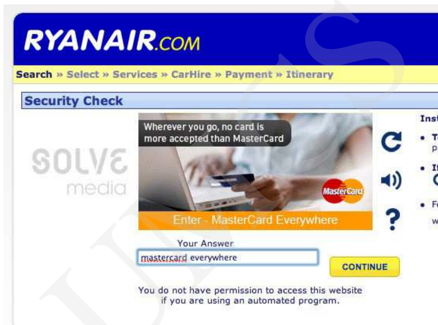
Ryc. 5. Ryanair – CAPTCHA

użytkownik i tak musi zapoznać się z reklamą, by przepisać tekst. Zapoznanie się z treścią reklamy jest zatem w tym przypadku nieuniknione 11 .