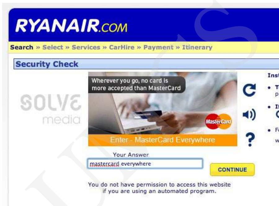
Ryc. 5. Ryanair – CAPTCHA

użytkownik i tak musi zapoznać się z reklamą, by przepisać tekst. Zapoznanie się z treścią reklamy jest zatem w tym przypadku nieuniknione 11 .