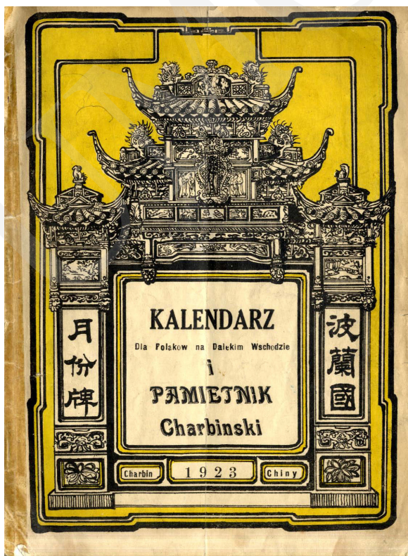
Fot. 1. Ze zbiorów Podlaskiej Biblioteki Cyfrowej 1923.

Badając zasoby poszczególnych bibliotek, można zauważyć, że istnieją edycje „Pamiętnika Harbińskiego” różniące się, aczkolwiek nieznacznie, treścią i formą wydawniczą. Przykładowo w zbiorach Biblioteki Uniwersyteckiej im. Jerzego Giedroycia w Białymstoku (online w Podlaskiej Bibliotece Cyfrowej) 36 znajduje się egzemplarz „Pamiętnika” z 1923 roku, posiadający kartę tytułową z wyobrażeniem chińskiej pagody i napisem „Kalendarz dla Polaków na Dalekim Wschodzie i Pamiętnik Charbiński” (fot. 1).