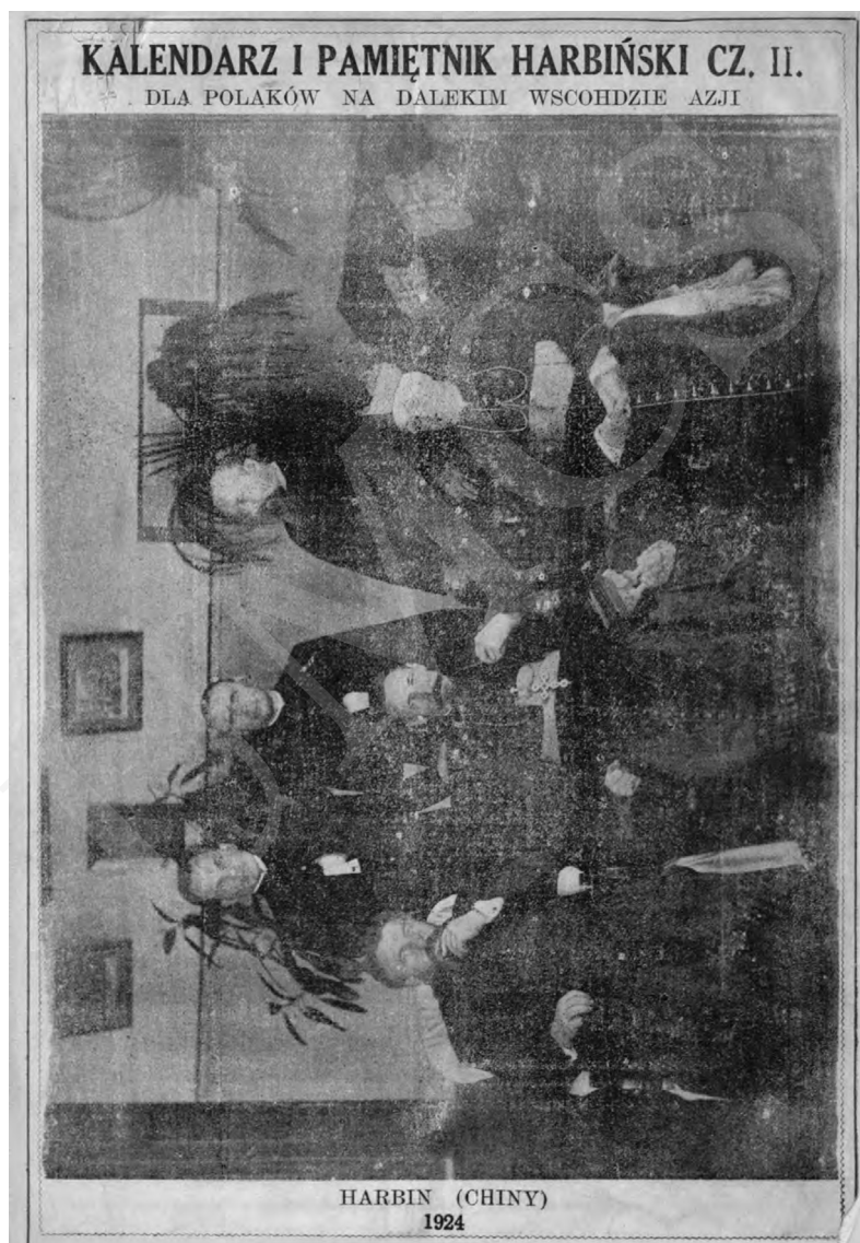
Fot. 3.

Żaden spis czasopism harbińskich, jak również bardzo wyczerpująca bibliografia Adama Winiarza nie wymieniają pozycji „Kalendarz dla Polaków na Dalekim Wschodzie”, „Kalendarz dla Polaków na Dalekim Wschodzie i Pamiętnik Charbiński” czy „Kalendarz i Pamiętnik Harbiński dla Polaków na Dalekim Wschodzie Azji”, stąd nie sposób obecnie stwierdzić, skąd wynikały różnice w poszczególnych wydaniach.