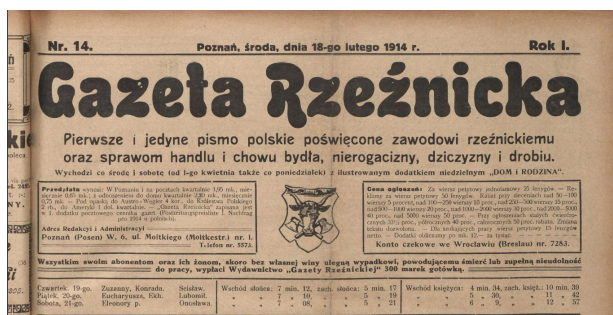
Ryc. 3.

Następny element winyety to informacje o częstotliwości. W pierwszym roczniku jest nieregularna – dwa razy w tygodniu: co środę i sobotą od numeru 1. do 19., trzy razy w tygodniu: co poniedziałek, środę i sobotą od numeru 20. do 76., ponownie dwa razy: co poniedziałek i czwartek w numerach 77. i 78. oraz co środę i sobotą od numeru 79. do 111. Numery od 104. do 107. pomimo oznaczenia: co środę i sobotą wydawane były 1 raz w tygodniu, w soboty. W tej części występuje informacja o dodatku niedzielnym „Dom i rodzina” w numerach: od numeru 2. (7 stycznia 1914) do numeru 69. (18 lipca 1914). Od numeru 72. brakuje dodatku niedzielnego. W 1918 r. gazeta była wydawana regularnie jako tygodnik co sobotę. Niżej zamieszczono dwie ramki z informacjami, po lewej stronie warunki przedpłat, adres redakcji i administracji, po prawej ceny ogłoszeń, rabaty stosowane przy ogłoszeniach większych i stałych oraz numer konta czekowego we Wrocławiu i Wiedniu. Pomiędzy ramkami znajduje się rysunek podobny do tego, który widnieje na pieczęci Cechu Rzeźników w Poznaniu: głowa byka na tle dwóch skrzyżowanych toporów, otoczony ramką. Pod nimi dwa ostatnie elementy występujące w pierwszym roczniku: informacja o ubezpieczeniu abonentów i ich rodzin oraz oddzielony kreską kalendarzyk z informacjami o imieninach, wschodach i zachodach słońca oraz księżycą na najbliższe dni, do następnego wydania.