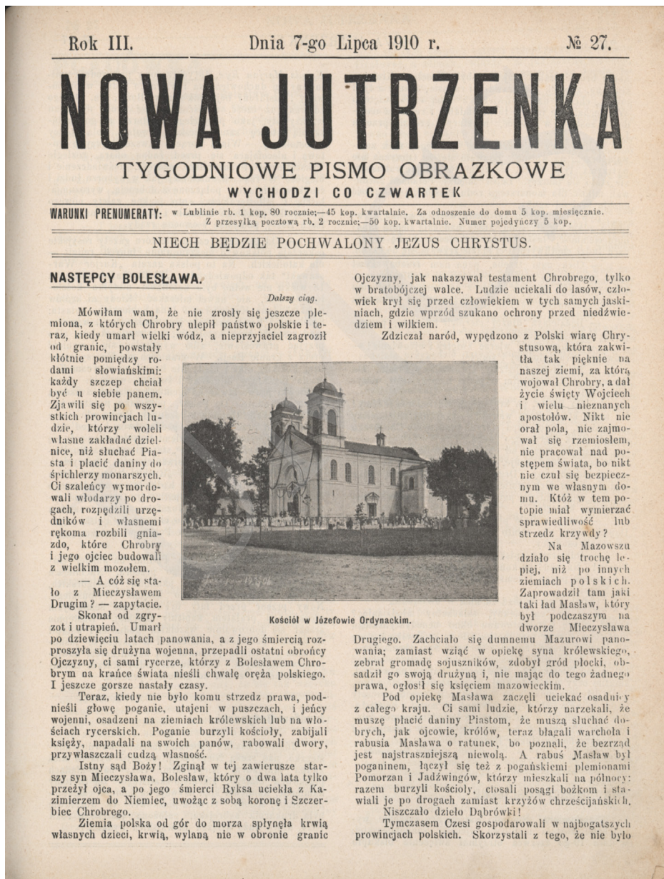
Rycina 1.

Jak wspomniano, tygodnik zawierał 8–12 stron. Pierwsze strony były poświęcone zwykle nauczaniu moralnemu w duchu nauki społecznej Kościoła katolickiego, autorstwa głównie księdza redaktora, ale również mogły być tu teksty historyczne, ob-