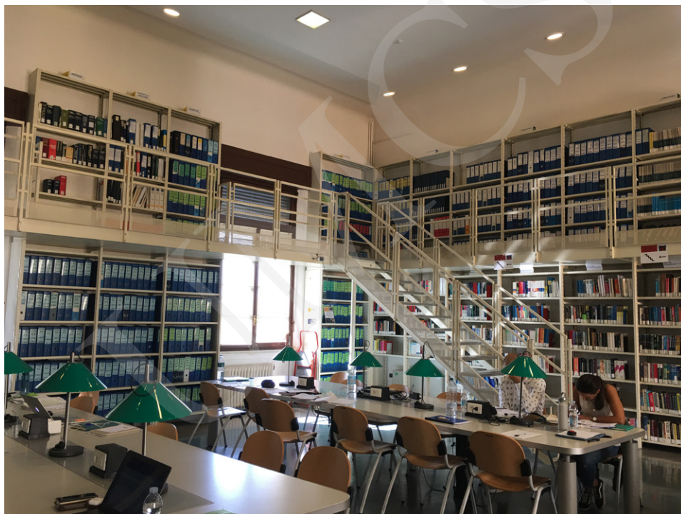
Fot. 4. Czytelnia Biblioteki POLO 5.

Normale. Podziw może wzbudzić adaptacja pomieszczeń dawnej wieży więziennej (Palazzo della Gherardesca) na potrzeby biblioteki i jej użytkowników. Odrestaurowany niedawno Palazzo del Capitano poza funkcjonalnością jest także ciekawym obiektem architektonicznym zachowującym ślady przeszłości w postaci łuków i pamiątkowych inskrypcji widocznych na fasadzie.