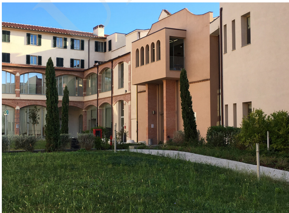
Fot. 1. Kompleks budynków POLO 6, fot. Ewa Rzeska.

Przemieszanie tradycji i nowoczesności charakterystyczne dla miasta oraz Uniwersytetu znajduje odzwierciedlenie w różnorodności architektonicznej i funkcjonalności Biblioteki Uniwersytetu w Pizie, która powstała i rozwijała się wraz z Alma Mater. Tworzy ją sieć specjalistycznych bibliotek tzw. POLO, powiązanych z poszczególnymi wydziałami: POLO 1: Rolnictwo (AGR), Ekonomia (ECO), Weterynaria (VET); POLO 2: Prawo (IUS), Nauki polityczne (SPO); POLO 3: Chemia (CHI), Matematyka, Informatyka, Fizyka (MIF), Nauki o ochronie środowiska (SNA); POLO 4: Medycyna, Chirurgia, Farmacja (MED); POLO 5: Inżynieria (ING); POLO 6: Kultura starożytna, językoznawstwo, germanistyka i sławistyka (ANT), Filologia angielska (LM2), Historia sztuki (STA), Filozofia i historia (FIL), Język i literatura romańska (LM1). Ponadto Uniwersytet posiada dwie biblioteki poza miastem: Nauk o turystyce (TUR) w Luce oraz Systemów Logistycznych (ELS) w Livorno. W Archiwum Głównym, które mieści się na peryferiach miasta, przechowywane są stare książki i dokumenty. W skład struktury Biblioteki wchodzi także Centrum Dokumentacji (CED), z którego mogą korzystać pracownicy naukowcy, studenci i pracownicy administracji uczelni. Wszystkie te jednostki funkcjonują w skoordynowanym systemie bibliotecznym, który nazywa się Sistema Bibliotecario di Ateneo, w skrócie SBA.