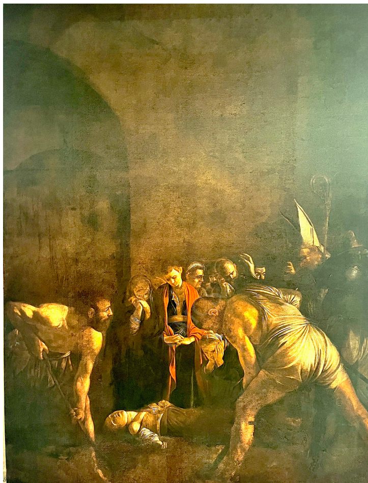
Ryc. 2. Caravaggio, Pogrzeb św. Łucji , Santuario di Santa Lucia al Sepolcro, Syrakuzy

Obraz ołtarzowy miał zostać wykonany do odnawianego w tym czasie, znajdującego się poza granicami miasta, kościoła św. Łucji 7 .