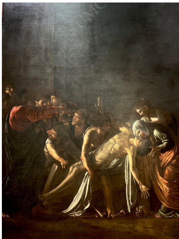
Ryc. 4. Caravaggio, Wskrzeszenie Łazarza , muzeum regionalne w Mesynie

Niedługo po namalowaniu Pogrzebu św. Lucji – być może autor nie doczekał nawet do momentu jego oficjalnego umieszczenia w ołtarzu, planowanego najprawdopodobniej na dzień św. Lucji (który na początku XVII wieku obchodzono nie 13 grudnia, lecz w czasie zimowego przesilenia, w najkrótszy dzień roku) – Caravaggio opuścił Syrakuzy i udał się do Mesyny. Zdobył tam zamówienie na ołtarzowy obraz przedstawiający wskrzeszenie Łazarza do kaplicy kościoła ojców Crociferi, opiekujących się chorymi (Langdon 2003: 388). Współcześnie znane Wskrzeszenie Łazarza może nie być pierwszą wersją obrazu, która prawdopodobnie została zniszczona przez samego autora pod wpływem emocji wywołanych uwagami pierwszych odbiorców na temat dzieła. Jest jednak z pewnością dziełem Caravaggia i nawiązuje do historii znanej z Ewangelii św. Jana.