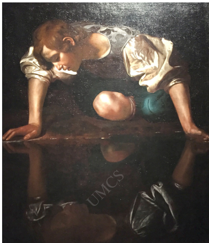
Ilustracja 1. Caravaggio Narcyz , 1597–1599 (Palazzo Barberini w Rzymie)