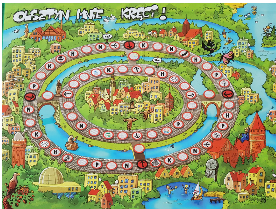
Fot. 2. Gra Olsztyn mnie kręci

została wydana w 100 egzemplarzach i była dystrybuowana głównie w olsztyńskich szkołach podstawowych i gimnazjalnych oraz w wybranych bibliotekach miejskich. Biuro Promocji i Turystyki Olsztyna prezentowało grę na krajowych targach turystycznych. Spotkała się także z dużym zainteresowaniem mieszkańców miasta, gdy uczyniono z niej nagrodę w konkursach organizowanych przez Miejską Informację Turystyczną.