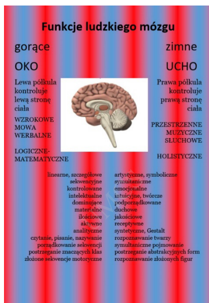
Diagram 2. Funkcje ludzkiego mózgu w koncepcji Marshalla McLuhana

obie półkule kontrolują jedno i drugie. Diagram opracowany na podstawie jego poglądów, pokazujący wpływ „oka” i „ucha” na umysł (zob. diagram 2), spopularyzowała Ewa Kuryluk (1977), przedrukowała go Marody (1987: 114), na końcu wykres trafił do dydaktyki – licealiści mogli zapoznać się z nim w podręczniku kształcenia językowego (Milewska i Milewska 2002: 31).