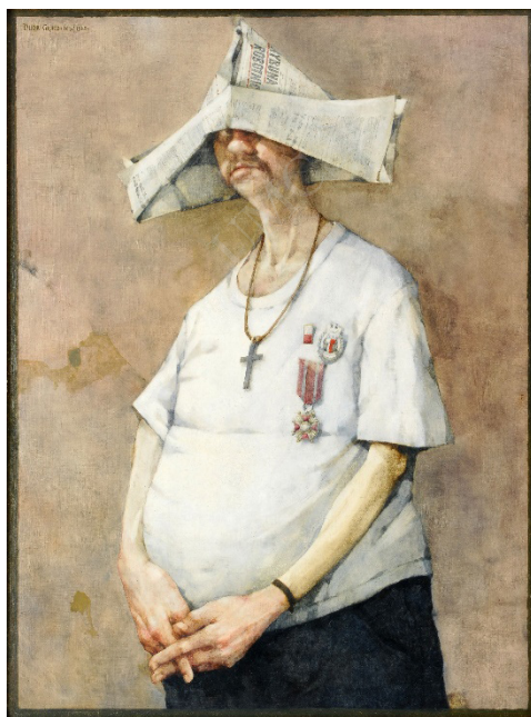
Ryc. 1. J. Duda-Gracz, Autoportret (Ora et kolabora) , 1982, olej na płycie pilśniowej, 80 x 60,5 cm

również portrety papieskie, portrety tamtejszych zakonników (także późniejszego zleceniodawcy Golgoty jasnogórskiej – o. Jana Golonki). W błędnej interpretacji obrazu, zanotowanej na kartach leksykonu, wysunięto na pierwszy plan kwestię zależności malarza od władzy i ustroju komunistycznego, odczytując mylnie wykorzystane w obrazie atrybuty (Chrzanowska-Pieńkos, Piętkos red. 1996). Artystę ta interpretacja ubodła, o czym wspomniał w kalendarium swej twórczości (Duda-Gracz 2001). Autorami wywodu o obrazie nie byli uczniowie i amatorzy, lecz zawodowcy i historycy sztuki, których trudno podejrzewać o tendencyjność czy złą wolę. Sądzę, że zadecydowało błędne rozpoznanie – odznaczenia państwowe i czapka z Trybuny Robotniczej zostały odczytane jako argument odnoszący się do faktów, a nie jako argument odnoszący się do sfery emocji.