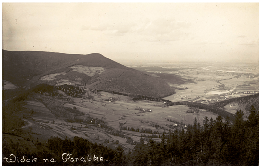
Fot. 2. Krajobraz rolno-pasterski Kozubnika oraz wschodniego grzbietu Hrobaczej Łąki z lat 30. XX wieku. Na pierwszym planie rolnicze zagospodarowanie Kozubnika. W tle pasterskie polany Żarnówki Małej, w tym polana Kosarzyska oraz polana Sadliki

Photo 2. The agro-pastoral landscape of Kozubnik and the eastern ridge of the Hrobacza Meadow from the 1930s. In the first plan the farming, development of the Kozubnik. In the background pasture glades of Żarnówka Mała, including the glade of Kosarzyska and the glade of Sadliki