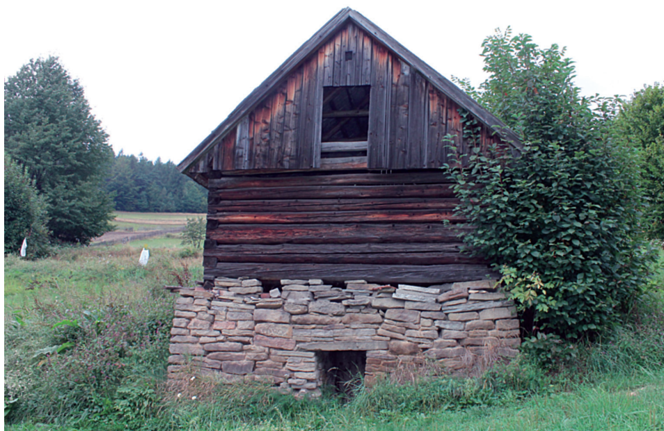
Fot.1. Piwniczka konstrukcji kamiennieo-drewnianej w Okrajniku Photo 1. The basement of stone-wooden construction in Okrajnik

Zabudowa gospodarcza. Świadkiem życia pasterskiego jest stuletnia kuźnia w Rzykach Jagódkach, będąca prawdziwą perełką etnograficzną. Do innych budowli związanych z działalnością pastersko-rolniczą należy zaliczyć drewniano-kamienne piwniczki m.in. w Kocierzu Rychwałdzkim oraz Okrajniku (fot.1).