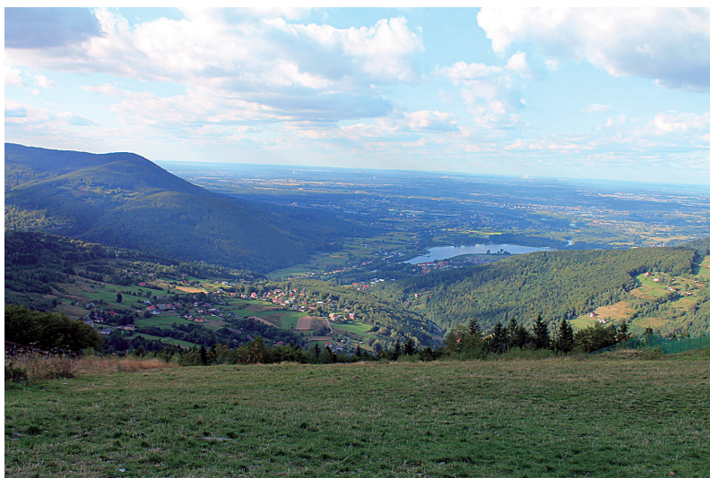
Fot. 3. Krajobraz rolno-pasterski Kozubnika oraz wschodniego grzbietu Hrobaczej Łąki z początku XXI wieku (2013 r.) – widoczny zanik granicy

Photo 2. The agro-pastoral landscape of Kozubnik and the eastern ridge of the Hrobacza Meadow from the 1930s. In the first plan the farming, development of the Kozubnik. In the background pasture glades of Żarnówka Mała, including the glade of Kosarzyska and the glade of Sadliki