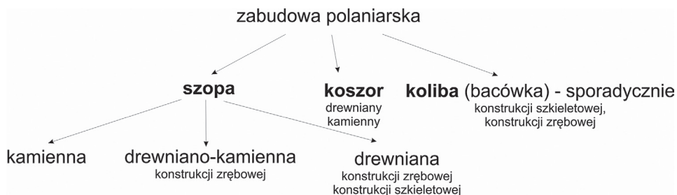
Ryc. 2. Struktura użytkowa i konstrukcyjna zabudowy polaniarskiej regionu Beskidu Małego Fig. 2. Usable and construction structure of the agro-shepherd buildings in the Little Beskid

odpowiednich prac. Jeżeli natomiast okres pobytu trwał kilka tygodni, to warunkiem przebywania na polanie było posiadanie schronienia dla ludzi i zwierząt. Rola tę pełniła szopa, której towarzyszyła rozbieralna, prymitywna kuchenka, kosor oraz sporadycznie koliba (ryc. 2).